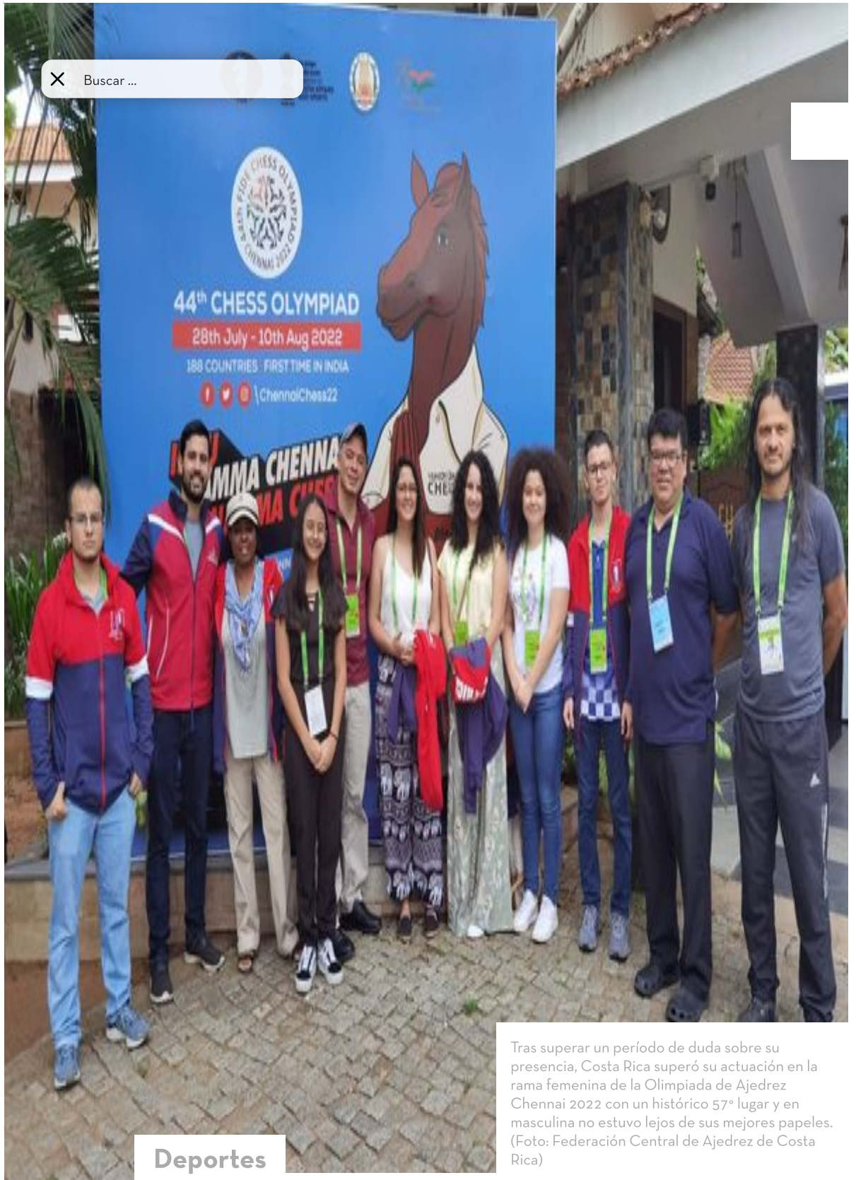
Tras superar un período de duda sobre su presencia, Costa Rica superó su actuación en la rama femenina de la Olimpiada de Ajedrez Chennai 2022 con un histórico 57° lugar y en masculina no estuvo lejos de sus mejores papeles.