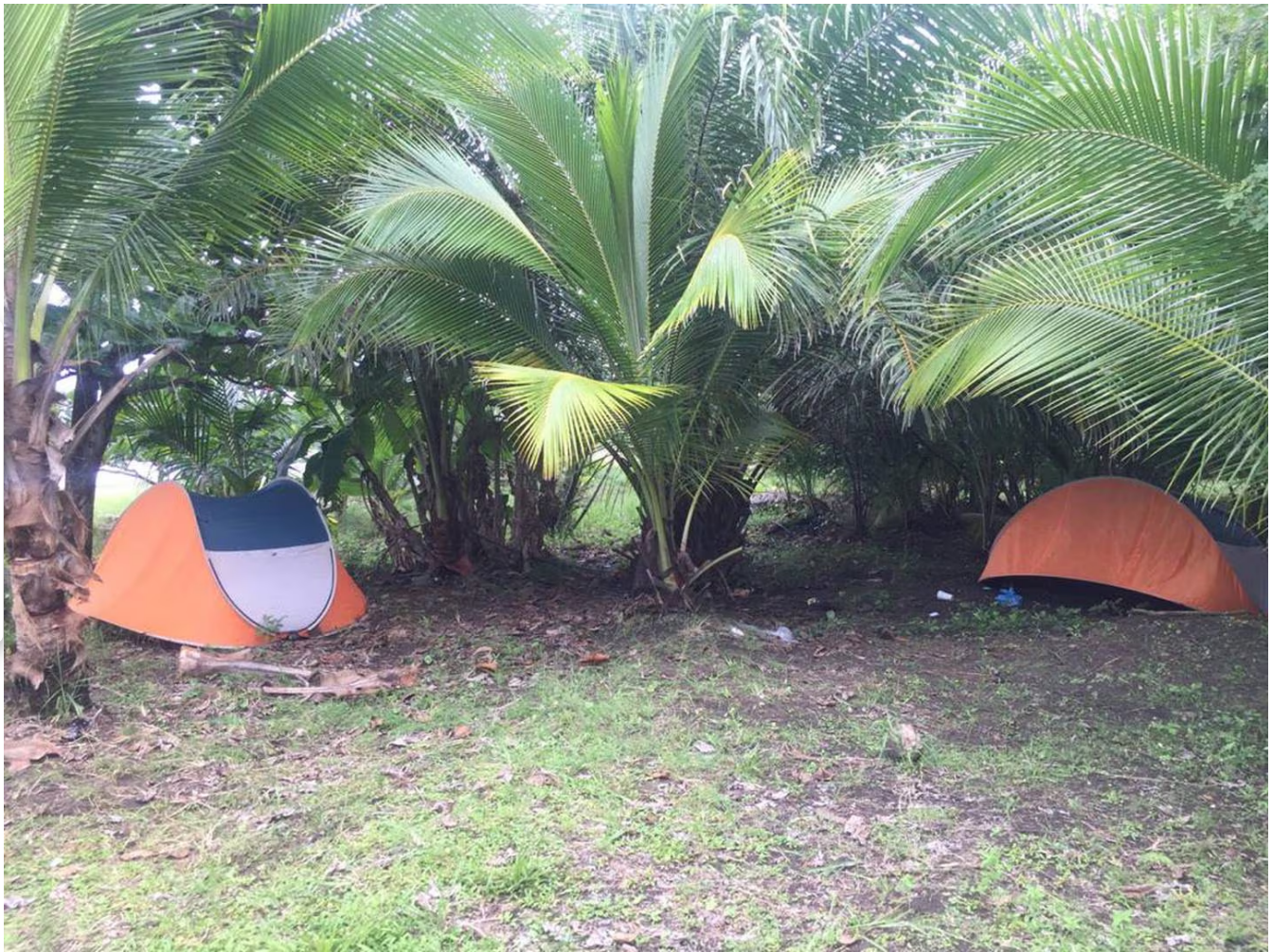
El cuerpo de Gabriela fue cubierto con una tienda de campaña en playa Moín.

A los allegados les extrañó que ella no enviara mensajes los días después de que salió a acampar. Al domingo siguiente, el 6 de junio del 2021, la comenzaron a buscar y el hijo de ella reconoció el cuerpo de su mamá.