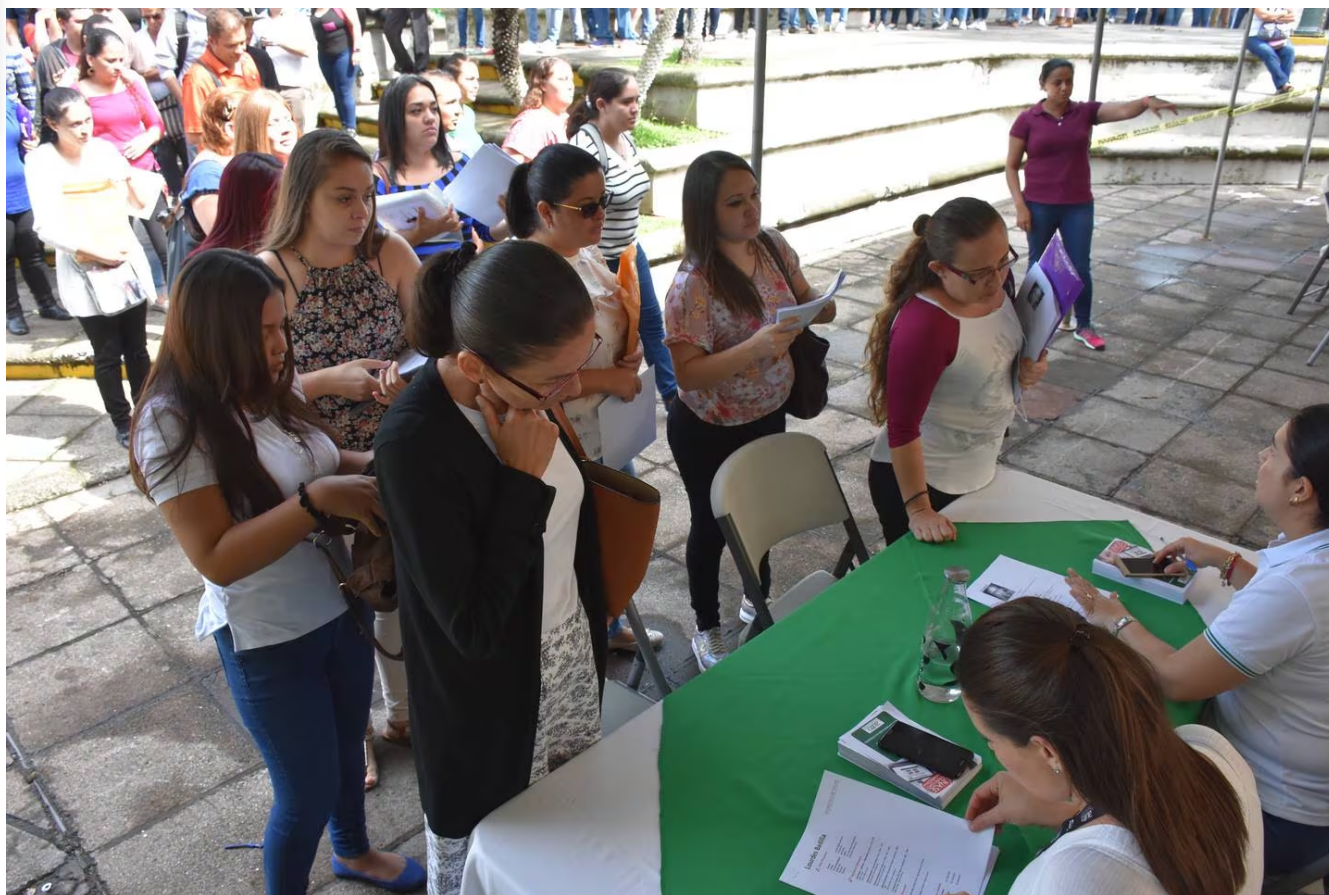
Feria de empleo para mujeres en Tibás. De las 115.000 personas entre 15 y 64 años que se retiraron del mercado laboral durante la pandemia y no regresaron, 77.000 fueron mujeres. Los especialistas coinciden en la necesidad de aumentar la participación femenina.