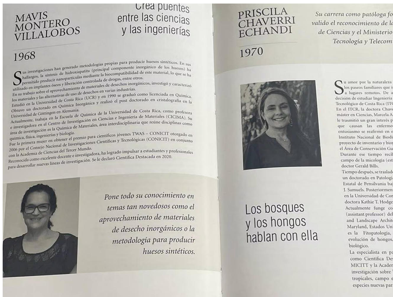
Las mujeres han tenido que abrir espacios en todos los ámbitos. En la imagen, dos de las científicas costarricenses más destacadas, entre muchas. (Ángela Ávalos)

En ese grupo están Vitalia Madrigal Araya (1884-1927), quien luchó desde una escuela de niñas por mejorar la educación femenina; y la autora de A ras del suelo , Luisa González Gutiérrez (1904-1999), alumna de Carmen Lyra y una de las fundadoras de la Escuela Maternal Montessoriana.