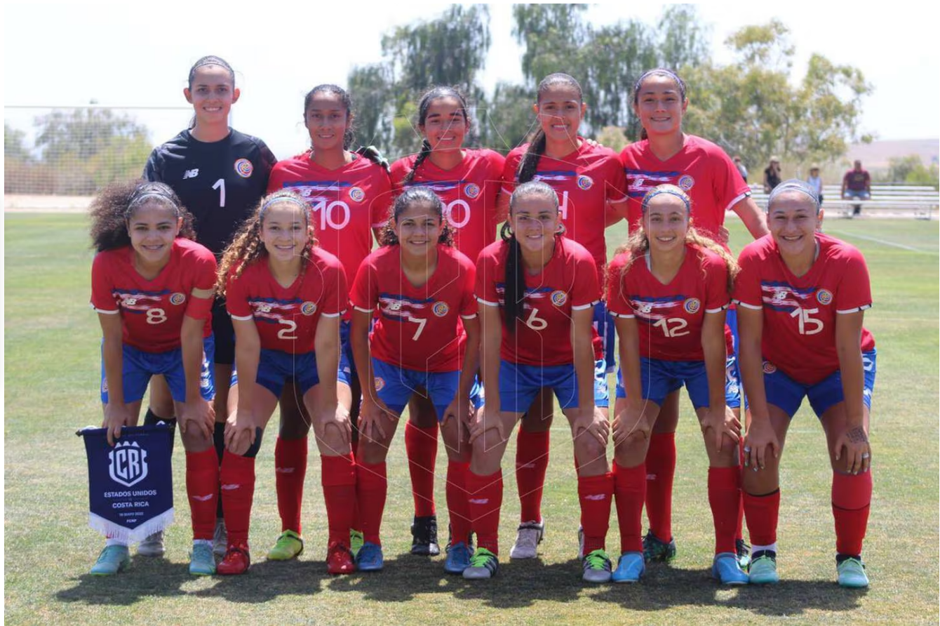
Las ticas se enfrentarán a las selecciones de Brasil, Australia y Nueva Zelanda.