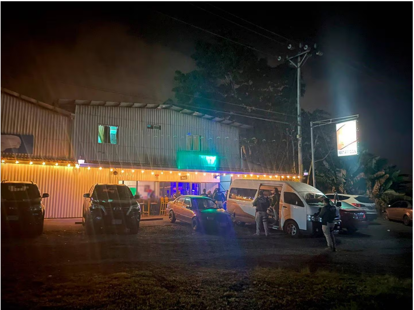
Las mujeres eran obligadas a vivir en el local.

Un grupo, conformado por una mujer y tres hombres, habría usado un bar como fachada para montar un negocio de prostitución, en el cual obligaban a varias mujeres a que les entregaran la mitad del dinero que estas cobraban por los servicios sexuales que ofrecían en el local.