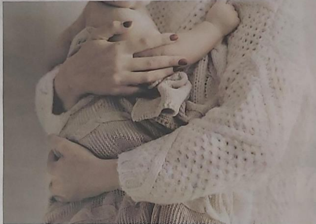
Los papás decidirían cómo sería el orden de los apellidos de sus hijos.

Proyecto de ley. Hace unos días, la Comisión de Derechos Humanos de la Asamblea Legislativa