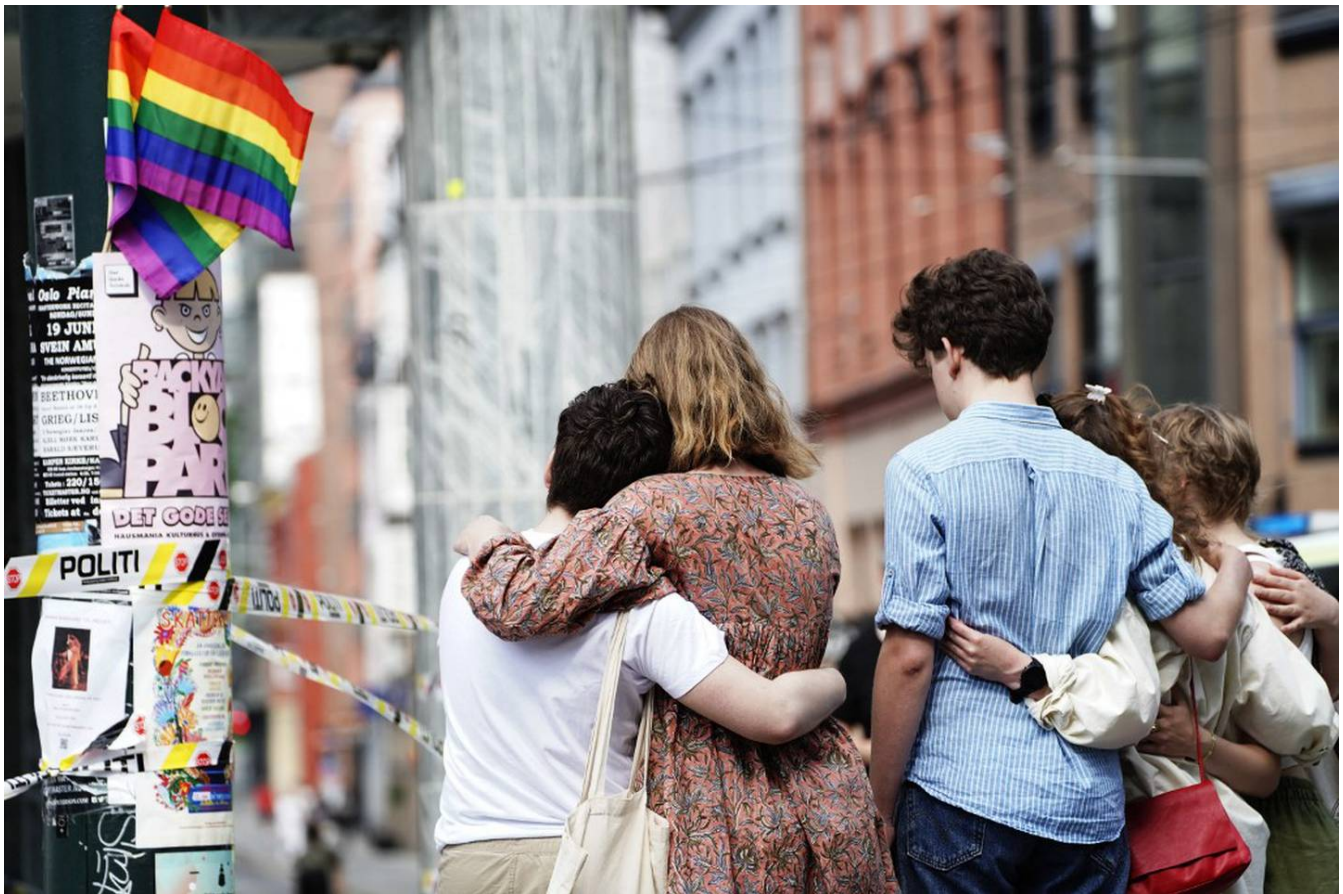
Jóvenes se lamentaron en la escena del crimen en el centro de Oslo, Noruega, luego del tiroteo afuera de clubes nocturnos.