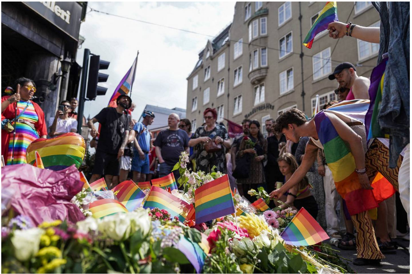
Personas con banderas del orgullo cerca del club nocturno en el centro de Oslo.