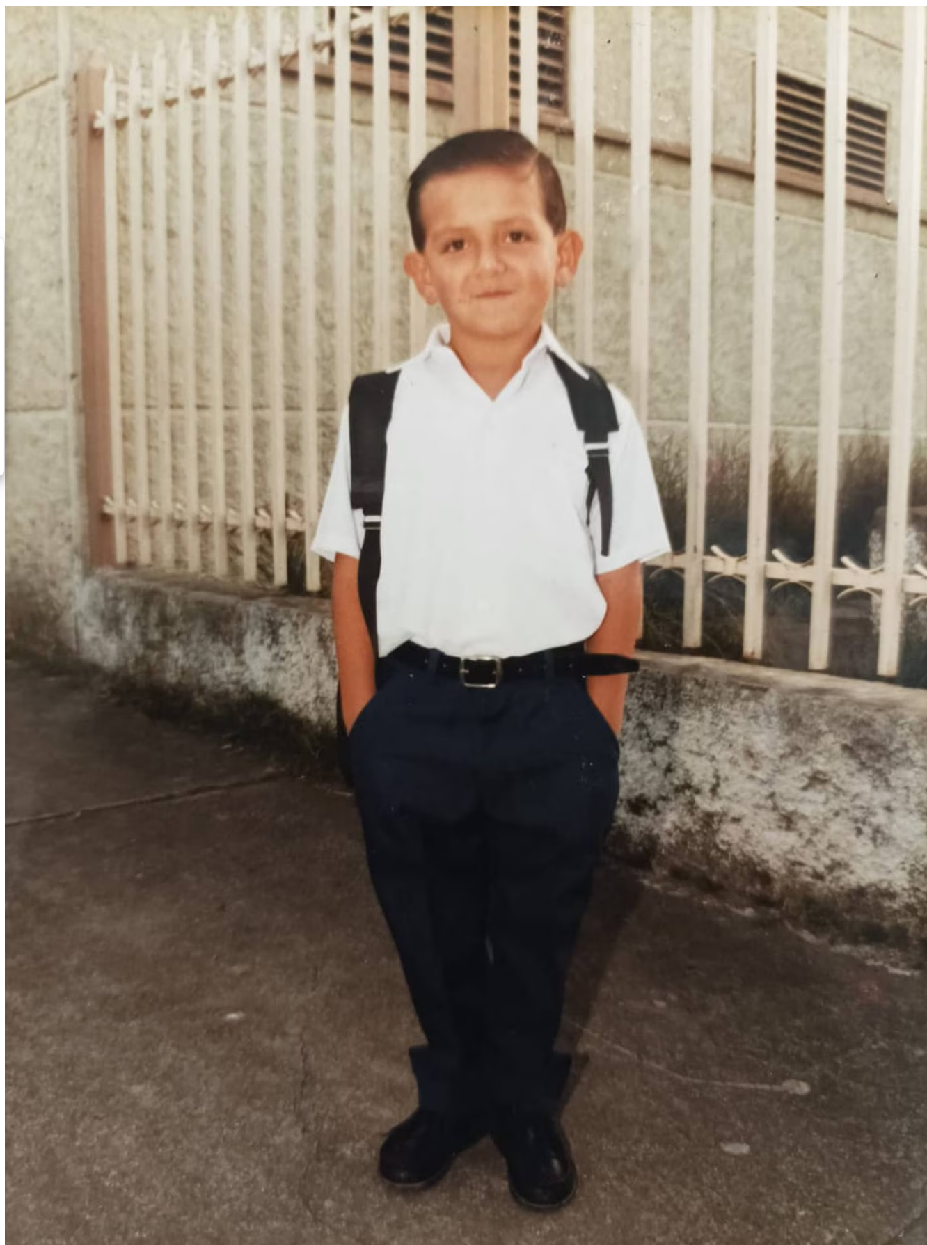
Desde los cinco años mandaron a llamar a sus padres porque ella les decía a los demás niños cómo se sentía.