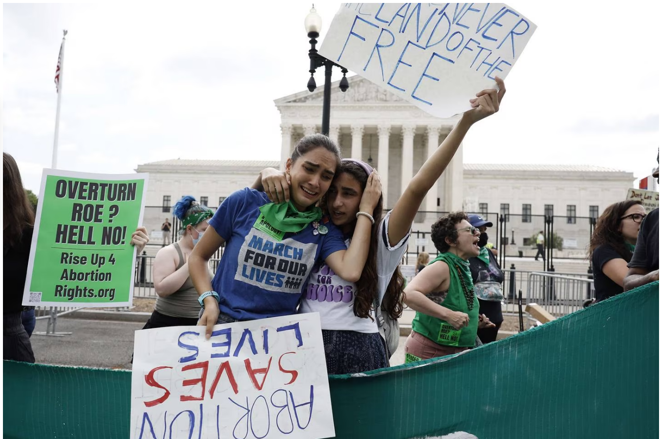
Activistas reaccionan al fallo que anuló el histórico caso de aborto 'Roe v. Wade' frente a la Corte Suprema de Estados Unidos.