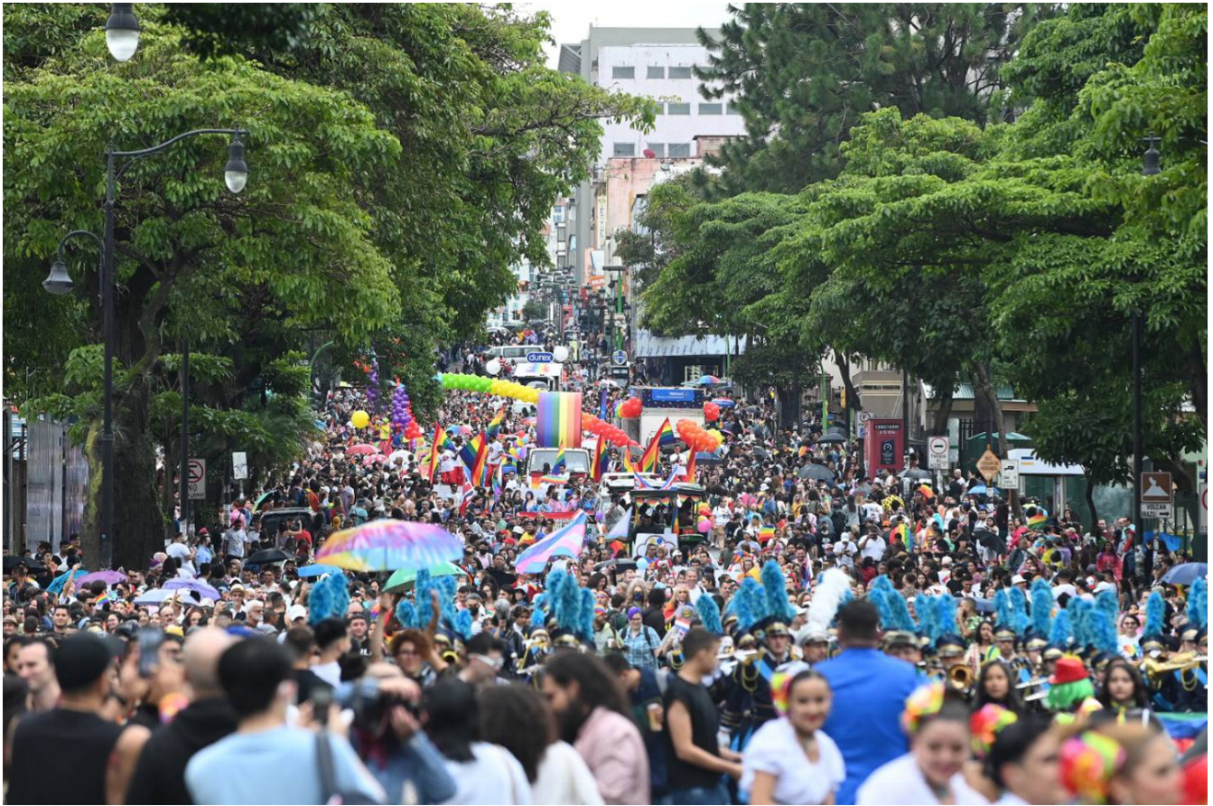
Mucho más de 500 mil personas llegaron a la Marcha de la Diversidad 2022.

“Salir del clóset es como liberarse de miles de cadenas que uno tiene amarradas. En estos tres años no puedo negar que me he topado con piedras en el camino, pero ninguna insuperable”, comentó Elías quien disfrutó de su primera Marcha de la Diversidad.