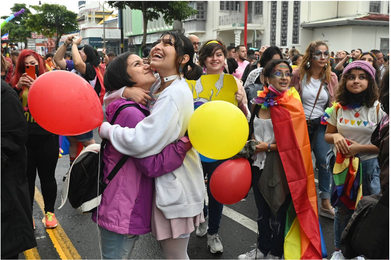
La marcha se realizó el orden y respeto. No hubo oficiales de Tránsito, pero tampoco incidentes.