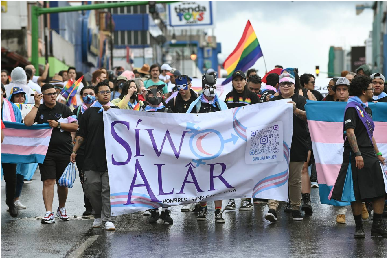
La organización Síwo Alâr Hombres Trans Costa Rica, fue mariscal de la marcha.