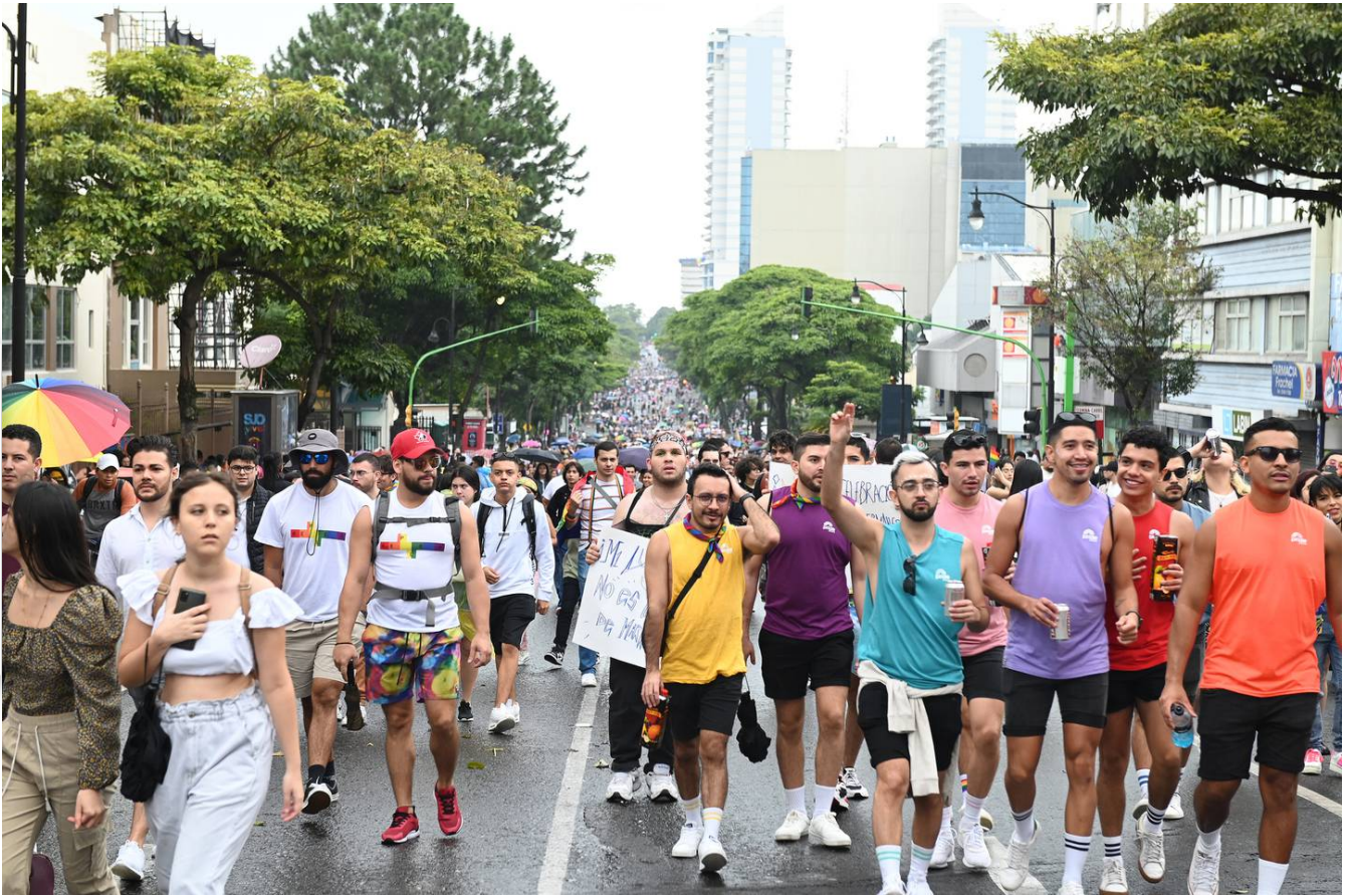
Pasado el medio día inició la marcha en el Parque Central de San José.

Por primera vez, desde la primera marcha en el 2008, el recorrido fue contravía: del parque Central hacia La Sabana para darle la espalda a los diputados, como parte de una protesta política ante la falta de leyes que protejan a la comunidad.