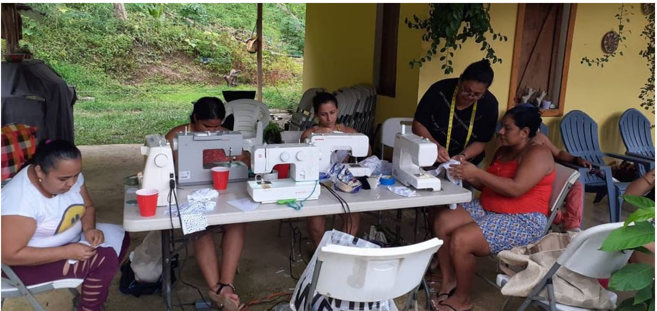
Las más de 63 señoras aprenden corte y confección de lunes a viernes de 8 a.m. a 12 medio día.

Entre costuras es como se llama el programa que les enseña a las mujeres a coser (incluso a hombres). También hay otros programas enfocados en la música, el arte, el cuidado del ambiente, la tecnología, los idiomas y el emprendedurismo.