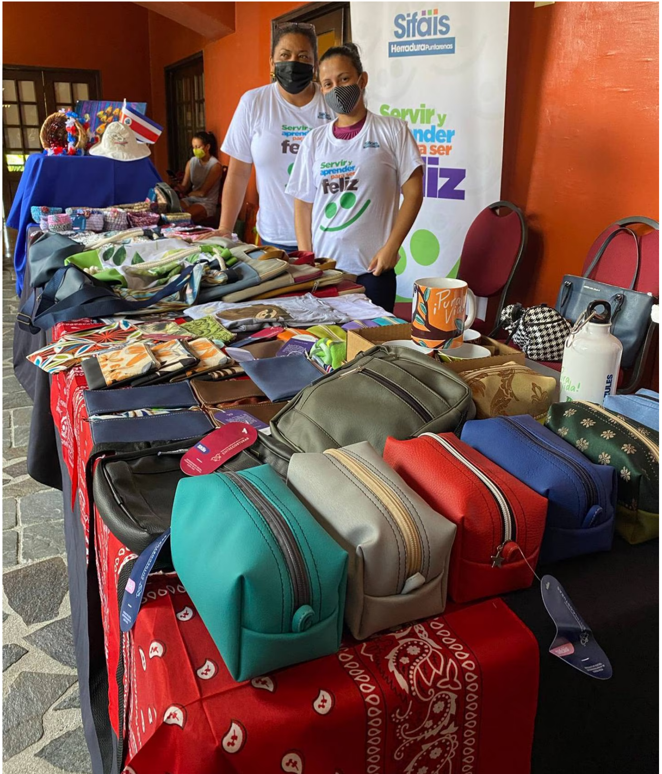
En Sifáis-Pacífico Central, aprenden a hacer diferentes tipos de manualidades y todo es para comenzar a ganar platica.