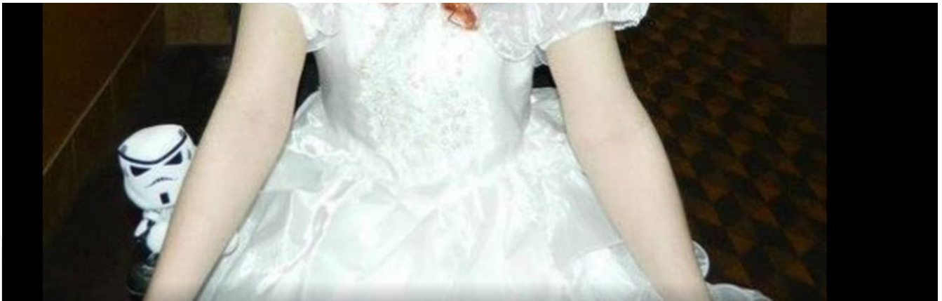
Gypsy Rose Blanchard cuando su mamá la disfrazaba. Facebook

“ Esa perra está muerta ”, apareció escrito en la cuenta de Facebook de Dee Dee Blanchard en la madrugada del 14 de junio de 2015.