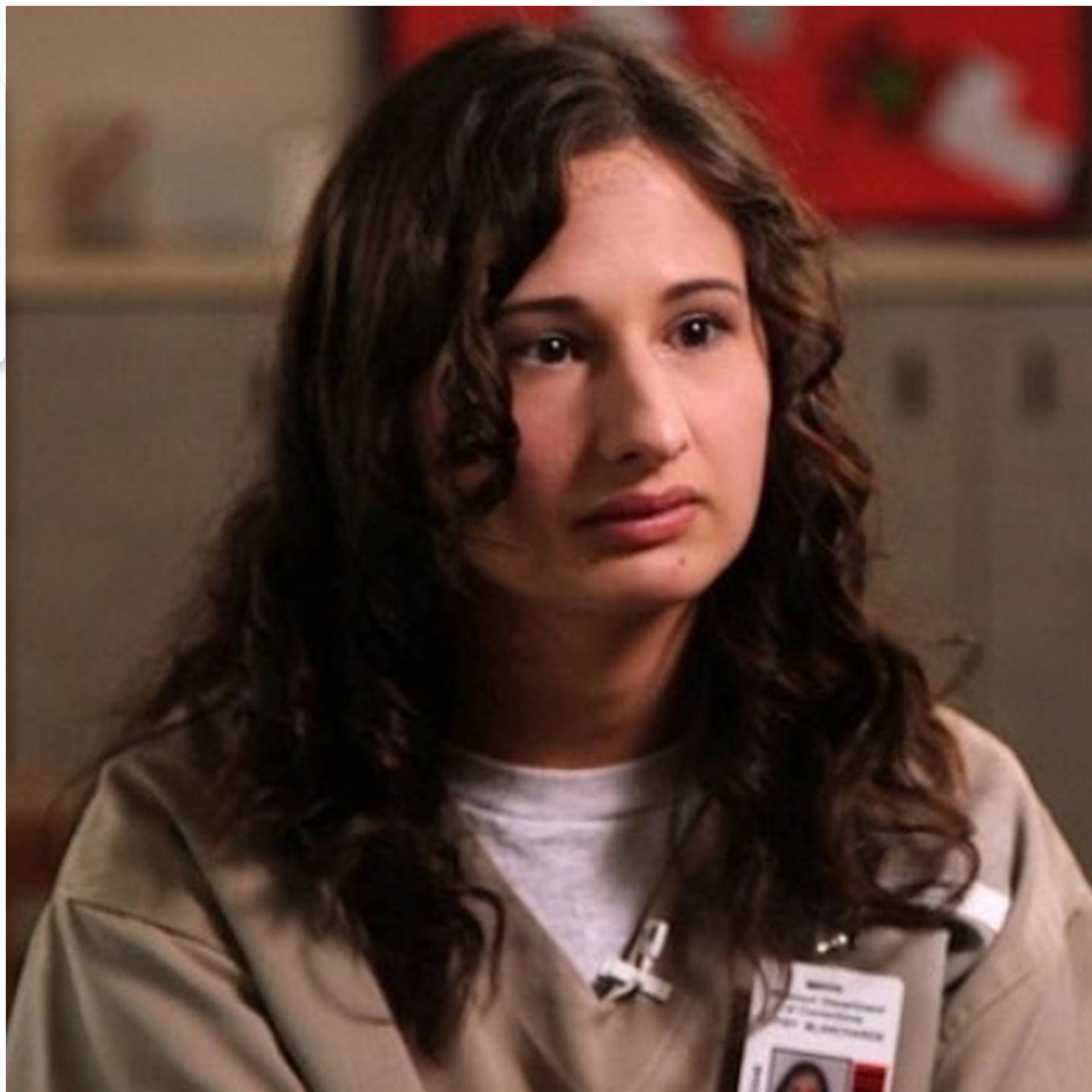
Gypsy Rose Blanchard en prisión en el 2021.

El único contacto que tuvo Gypsy con el exterior fue por medio de internet. Aunque Dee Dee también controlaba su acceso a la computadora, Gypsy se aprendió la contraseña para ingresar y por las noches, mientras su mamá dormía, ella se conectaba a una página cristiana para buscar pareja .