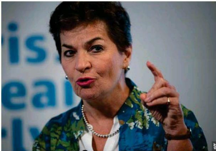
Christiana Figueres es todo un orgullo para el país.

23 abr. 2022 +1 más Adrián Galeano Calvo adrian.galeano@lateja.cr