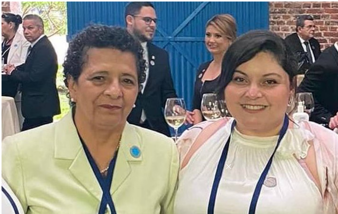
En la foto las jerarcas Adilia Caravaca Zúñiga, presidenta ejecutiva del Inamu (izq) y Cindy Quesada, ministra de la Condición de la Mujer (dcha).

100 conductores ya recibieron capacitación para aplicar un protocolo para estos casos. Dichas capacitaciones se brindaron con el apoyo de la Defensoría de los Habitantes, el Instituto Nacional de Aprendizaje (INA) y la Cámara Nacional de Transporte.