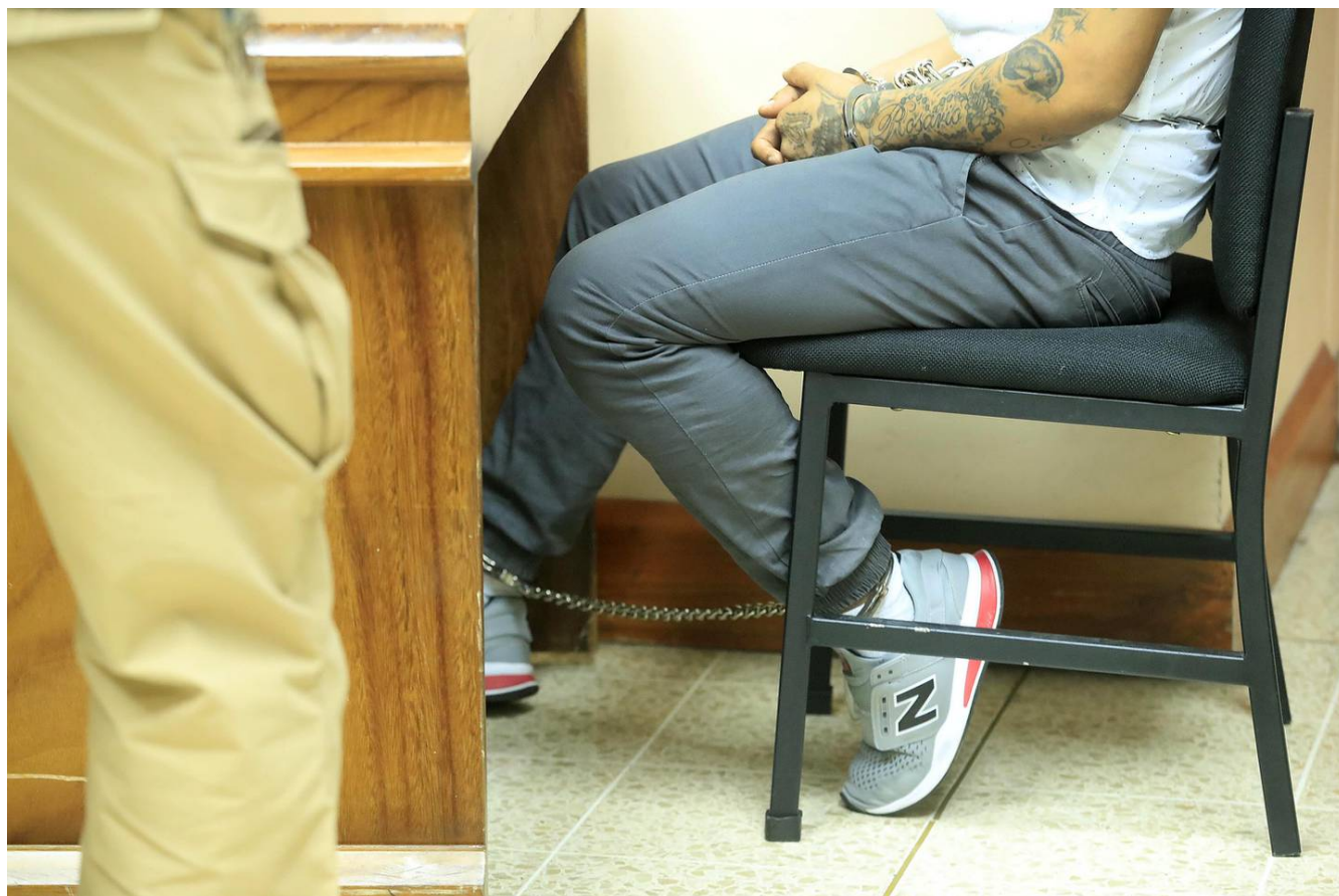
Al tipo lo andaban esposado y estaba custodiado por los agentes de cárceles del OIJ.

La familia dice que ella era una mujer que se ejercitaba, era independiente y se preocupaba mucho por sus seres queridos, pero ahora necesita que alguien siempre esté junto a ella ante cualquier necesidad.