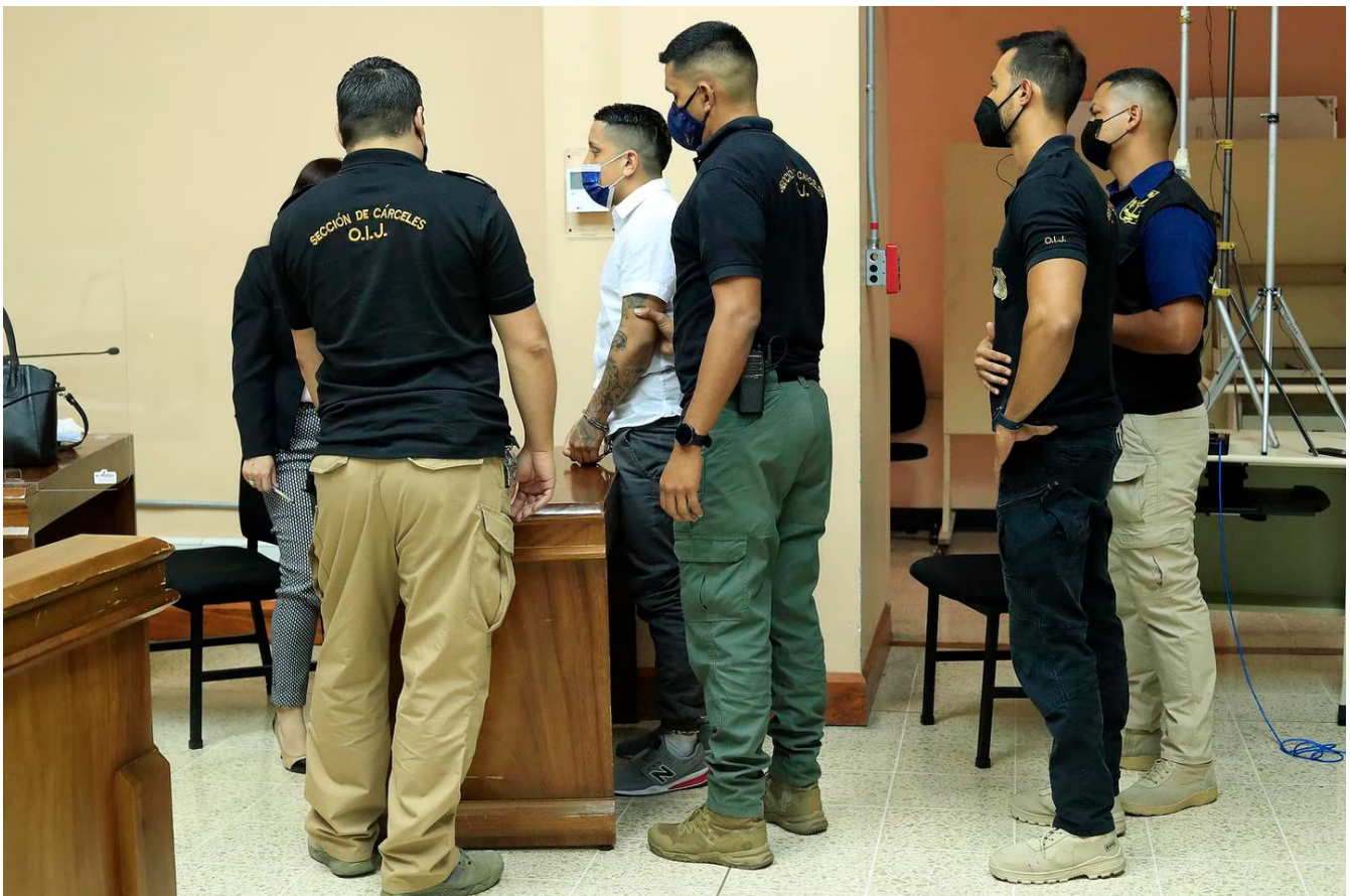
El imputado escuchó su condena de 38 años y tres meses de pie.

“El Tribunal tuvo por demostrado que el 1 y 3 de agosto del 2020 suscitó una diferencia con la (víctima) y esto implicó que usted la tomara del cuello con fuerza, igualmente se determinó que el 17 de agosto del 2020 usted incurrió en amenazas y de una forma muy reprochable, usted le indicó que no le iba a hacer daño a ella, sino a lo que más quería, en alusión al hijo de la víctima, un menor de edad, lo cual es inaceptable”, señaló el juez.