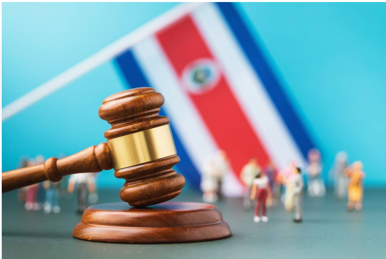
Sujeto purgará 30 años de cárcel por tres delitos de violación.

LEA MÁS: Sujeto purgará 27 años de cárcel por asesinar a la madre de su hijo