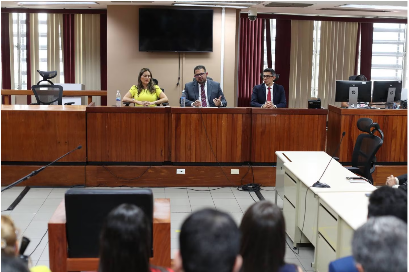
El 21 de abril, el Tribunal de Goicoechea leyó la sentencia ante una sala repleta.

La Mansion Inn, ahora llamado Oceans Two, también apeló, pues junto a Herrera fueron condenados a pagar ¢795 millones por daño material, ¢80 millones por daño moral y otros ¢53 millones por daño moral a la víctima, en favor de los padres y hermanos de la víctima.