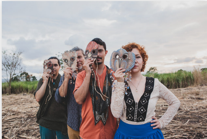
La canción “Afortunada” fue grabada el año pasado en coproducción con Cuba a través del fondo Ibermúsicas.

La obra musical, en la que colaboraron colegas de Zúñiga y la Orquesta Lunar, fusiona polirritmias africanas, notas pedal y paisajes sonoros con elementos de la música clásica y étnica.