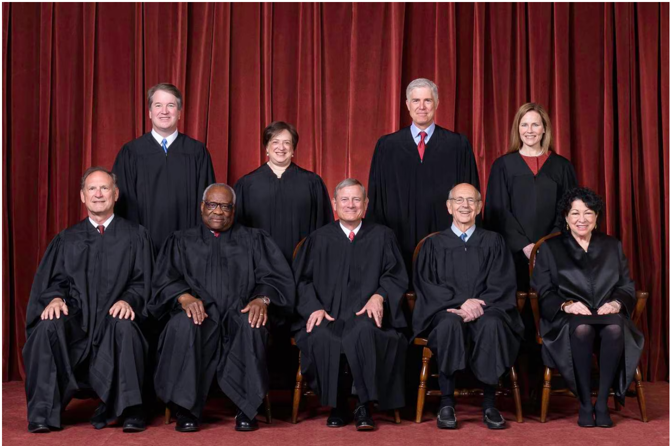
Descartar medio siglo de jurisprudencia sobre el aborto implica que la Corte Suprema de EE. UU. tiene demasiado poder.