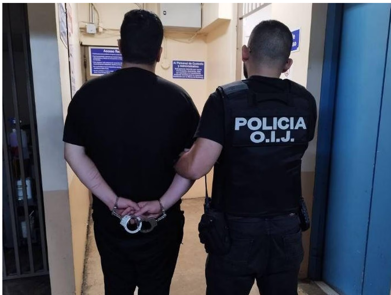
El hombre de apellidos Martínez Varela pasará dos meses preso.

Los hechos fueron denunciados el jueves pasado por la madre de la víctima quien, recientemente, se convirtió en mayor de edad. Pero el caso, aparentemente, empezó desde octubre del 2022 cuando la muchacha tenía 15 años.