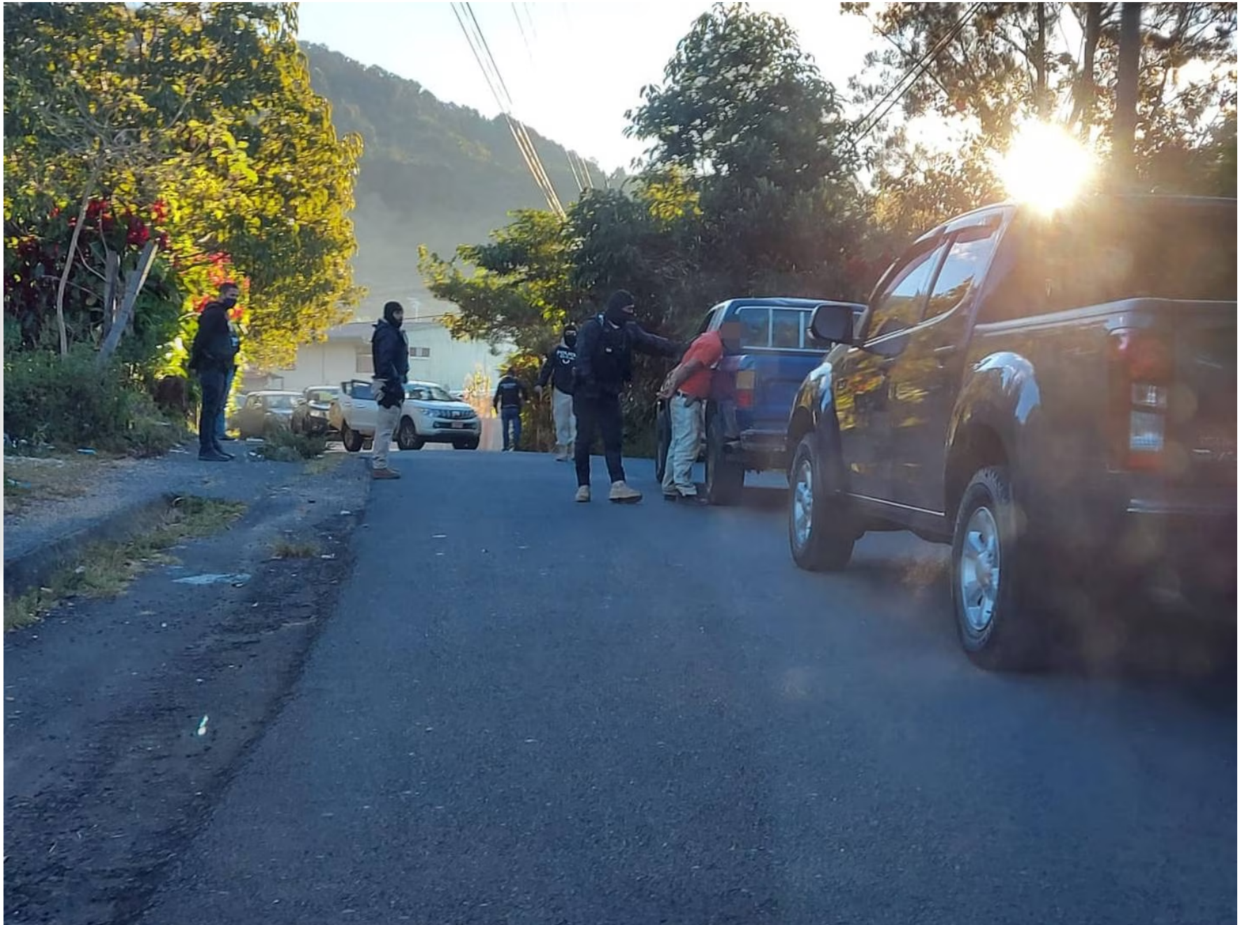
El crimen ocurrió en León Cortés.