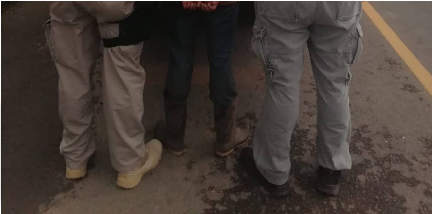
El sospechoso irá a prisión preventiva.

Según la investigación, luego del ataque, Ríos habría llevado los cuerpos hasta un precipicio utilizado para botar basura, donde los lanzó, supuestamente, para intentar ocultarlos.