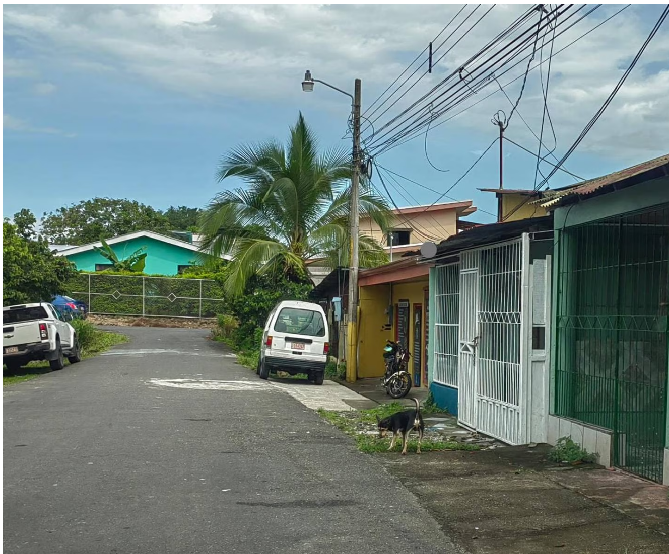
La vivienda de portón blanco donde ocurrió el asesinato de la mujer, permanecía con un candado la mañana de este martes.