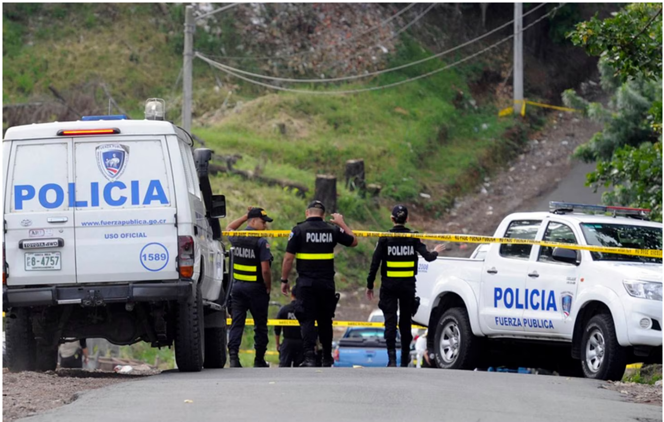
La tendencia indica que en este 2023 habrá más homicidios que muertes por accidentes de tránsito.

Por esas tres causas, más homicidios, fallecieron 19.154 personas menores de 34 años en 22 años. De ellas, 7.702 en accidentes de tránsito (40%); 5.902 por homicidios (31%); 3.453 por suicidio (18%) y 2.097 por ahogamiento (11%).