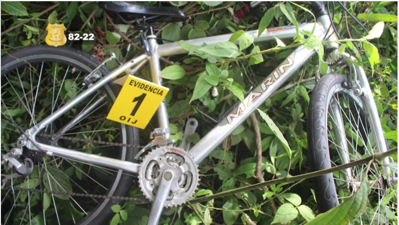
Esta fue la bicicleta usada por el gatillero en el homicidio.

LEA MÁS: Bala perdida mató a mujer que disfrutaba con su familia en río Barranca