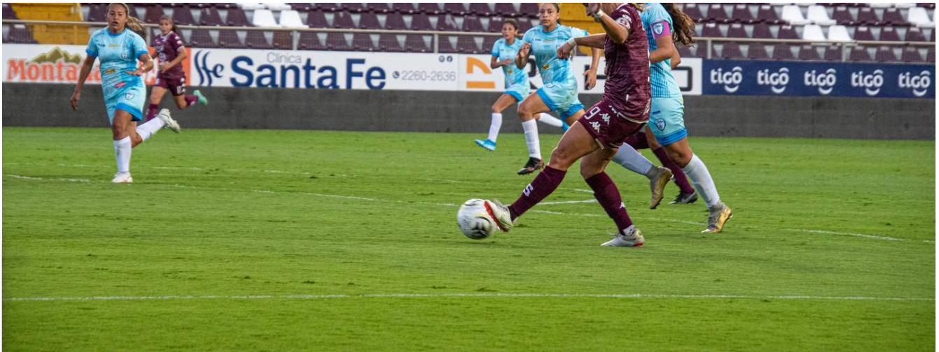
Saprissa vs Suva Sports. Estadio Ricardo Saprissa.