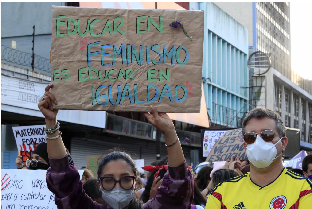
Marcha del Día Internacional de la Mujer el 8 de marzo del 2022 (imagen ilustrativa).

Los transexuales pidieron reforzar o incluir “el tema del enfoque de género y diversidad sexual desde la primera infancia para generar el cambio”.