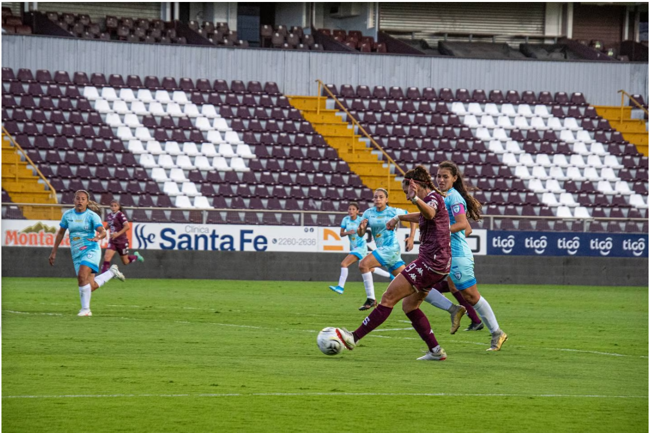
Saprissa derrotó a Suva Sports 9-0.