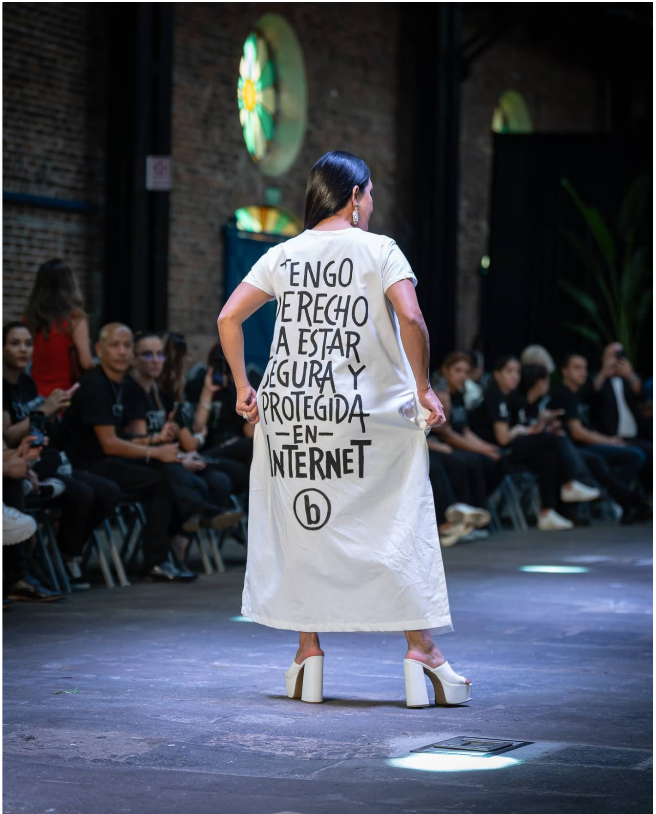
Mujeres mostraron importantes mensajes en la pasarela.