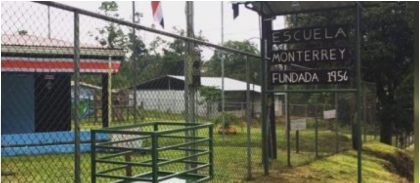
Escuela de Monterrey, El Alto, de San Carlos

Radio Santa Clara fue el medio que expuso el caso.