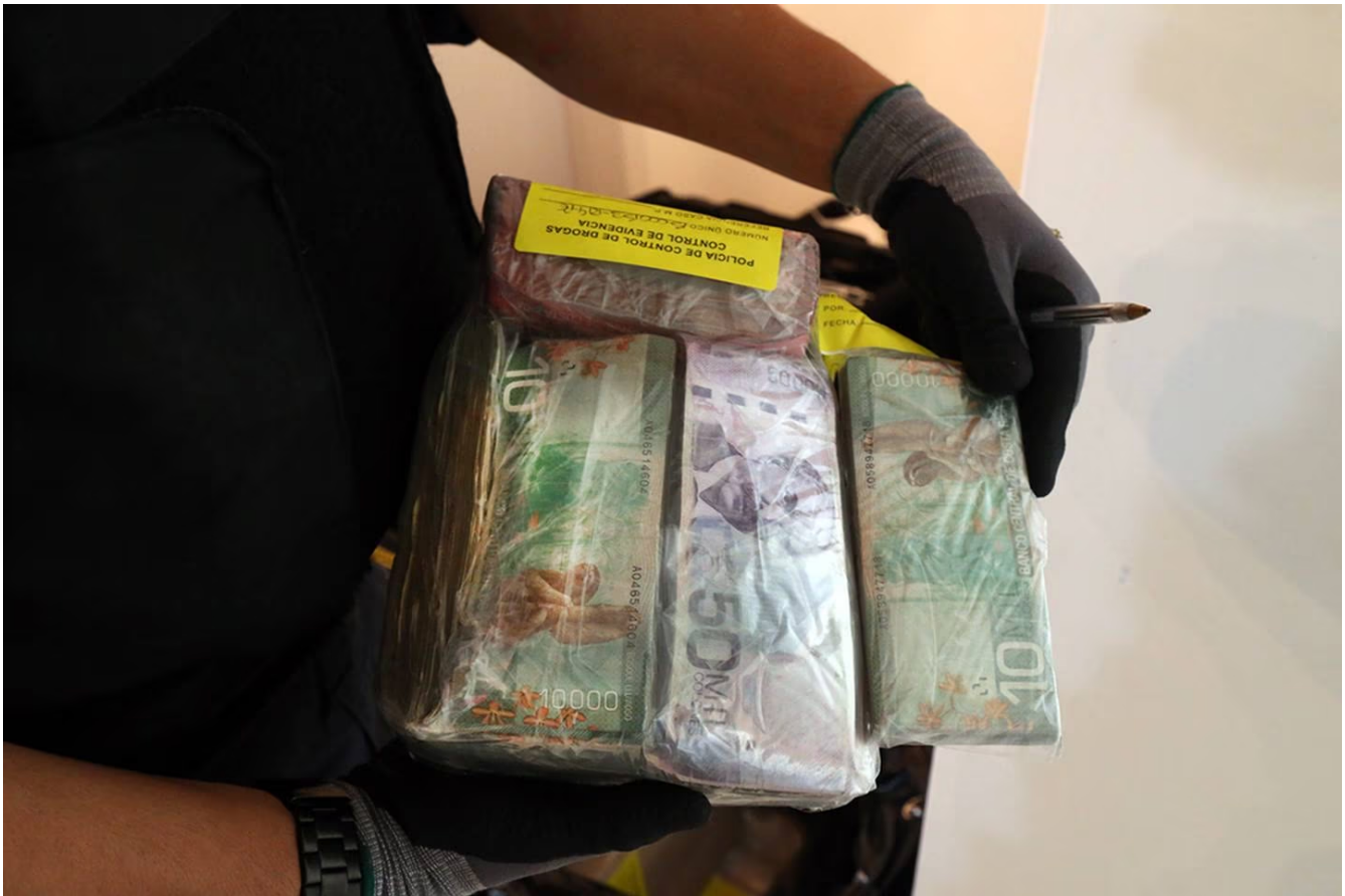
En la casa de Priscilla Crespi en Heredia encontraron ¢7 millones en efectivo.

Como parte de los indicios para verificar la participación de Priscilla Crespi en el delito, se tuvo por probado que era una persona a la cual no se le conocía trabajo fijo. Asimismo, que durante el allanamiento a su apartamento, ubicado en el centro de Heredia, le fueron decomisados tres celulares, uno de los cuales estaba intervenido y de ese número se hicieron grabaciones de llamadas telefónicas que la ligaban con los hechos. Además, encontraron ¢7 millones en efectivo.