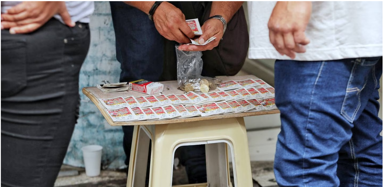
Este domingo 19 de diciembre es el sorteo del Gordo navideño. (JOHN DURAN)