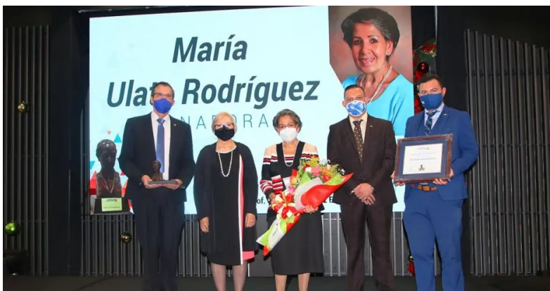
El premio "Carlos Luis Sáenz Elizondo 2021", destaca el ejemplo de los participantes por el carácter altruista, trascendencia de la labor dentro del Magisterio Nacional y el impacto de su participación en la vida comunal.