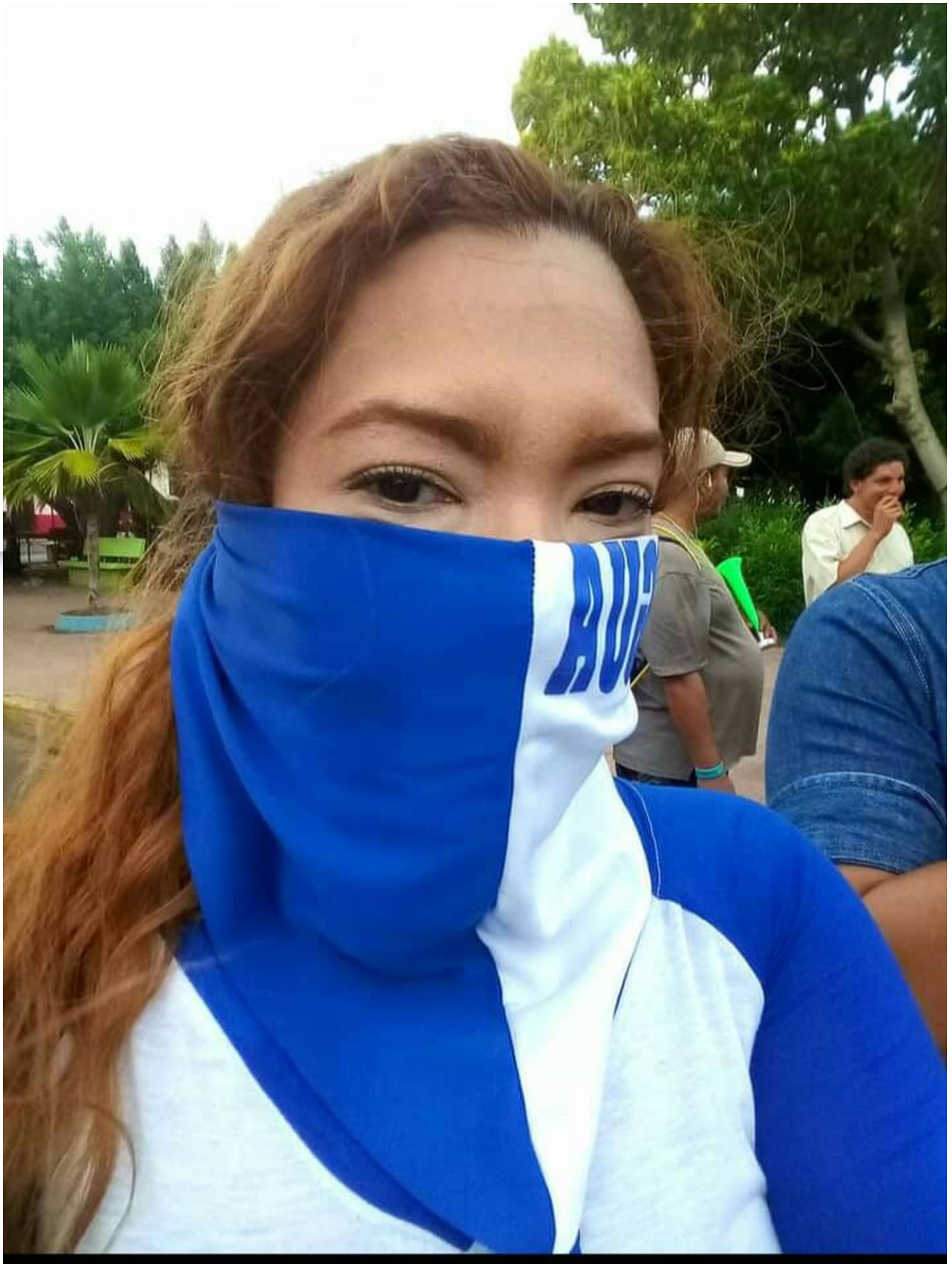
Asegura la activista que por su amada Nicaragua siempre levantará la voz.