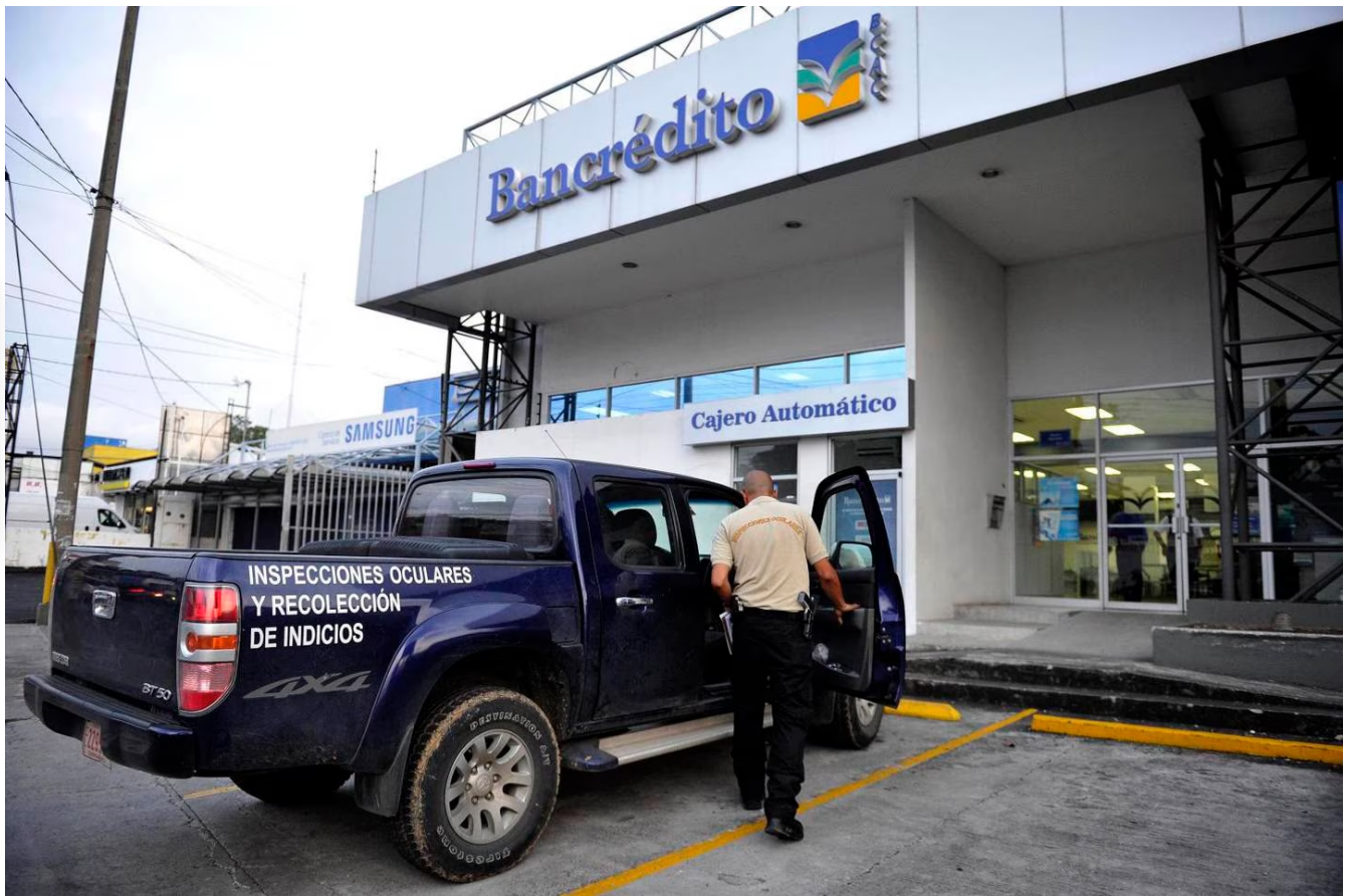
Un guarda encontró al bebé metido en una bolsa, que estaba dentro de un basurero del baño.