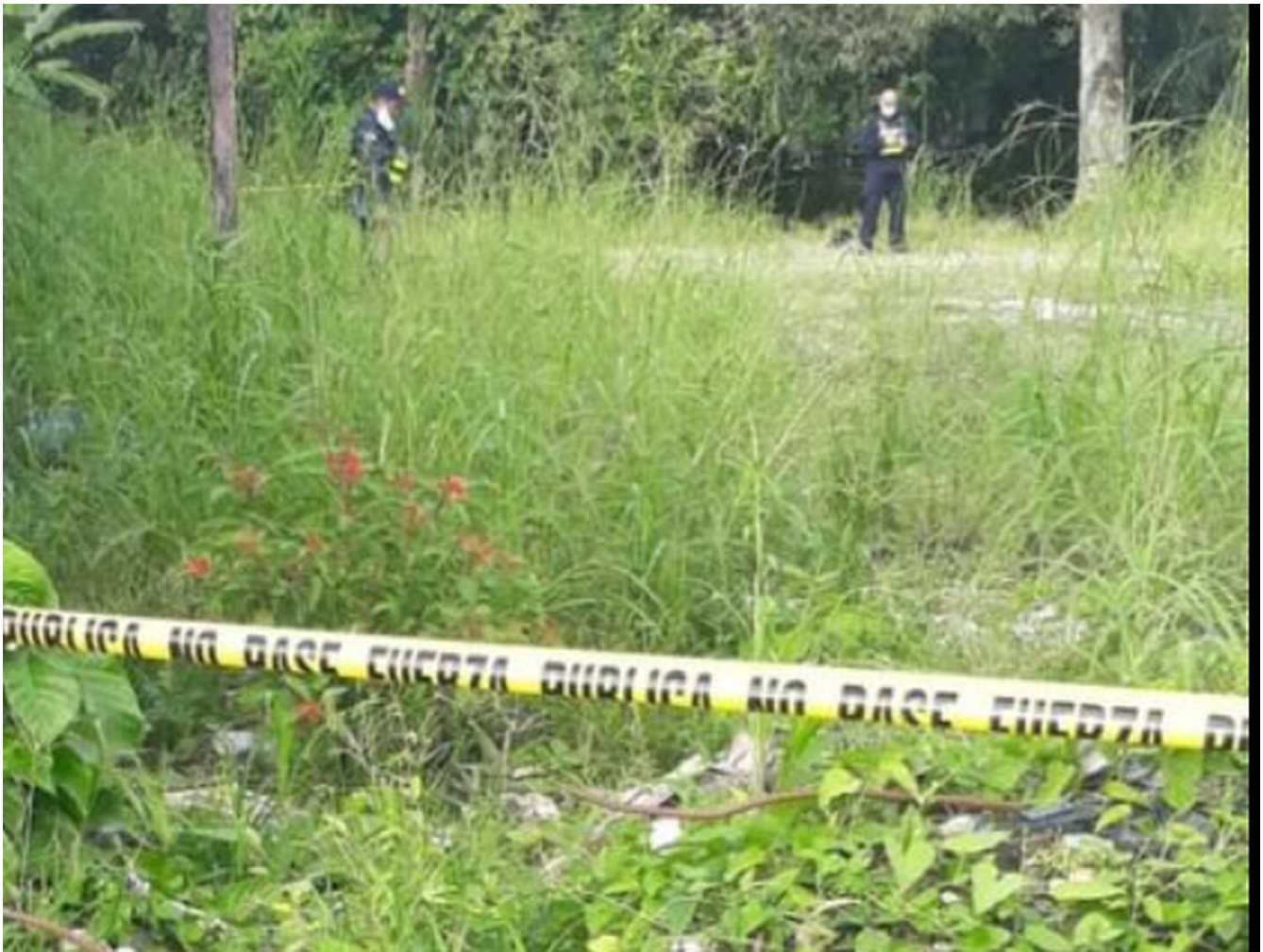
El cuerpo de Seidy Valle Piñar apareció en este lote baldío en el centro de Río Claro de Golfito, Puntarenas.