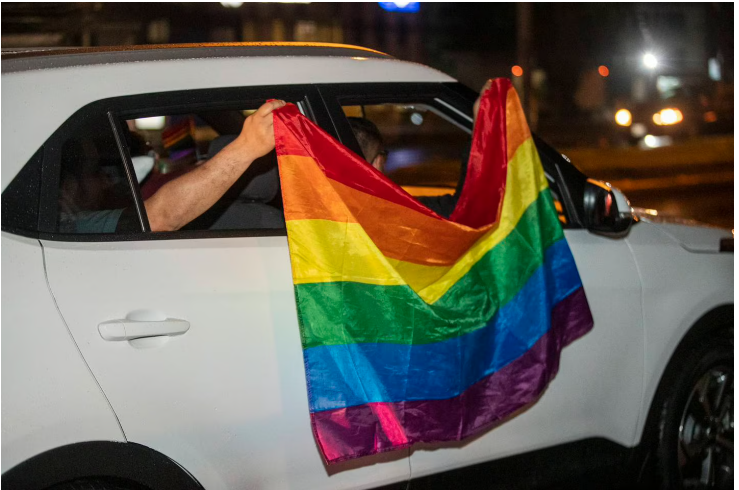
La Comisión Interamericana de Derechos Humanos (CIDH) instó a los países latinoamericanos a que reformen sus leyes para autorizar el matrimonio igualitario en donde no está permitido, y rechazó el uso de “argumentos religiosos”.