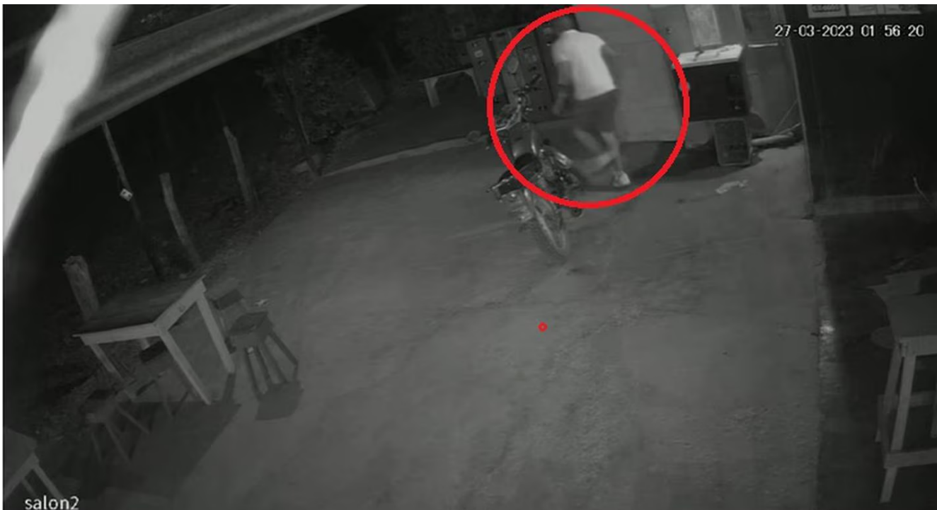
Calderón huyó por la parte trasera del bar.

“En algunas noticias se ha dicho que era la expareja de ella, pero realmente era la pareja actual. Ellos vivían juntos, pero era reciente, tenían poco, por ahí de unos tres meses tal vez”.