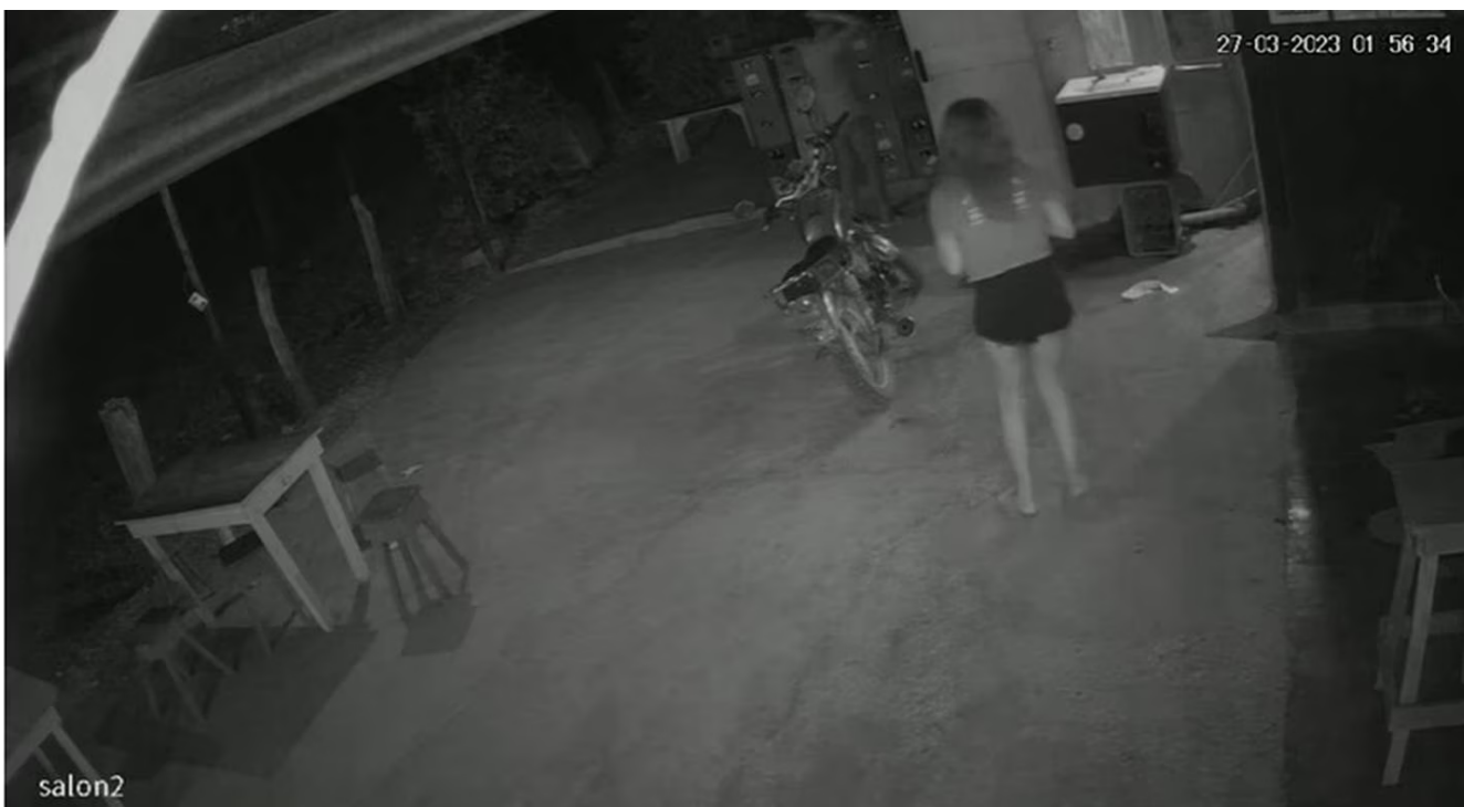
Las trabajadoras del bar quedaron impactadas al ver la escena.

“Eso es lo que se extraña, porque ahí en los videos se les veía compartiendo normal, pero según tengo entendido el hombre este la amenaza, eso es lo que se dice, que el hombre este era muy celoso”, detalló.