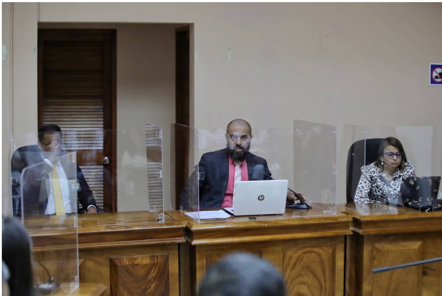
El tribunal aseguró que hubo muchas dudas.