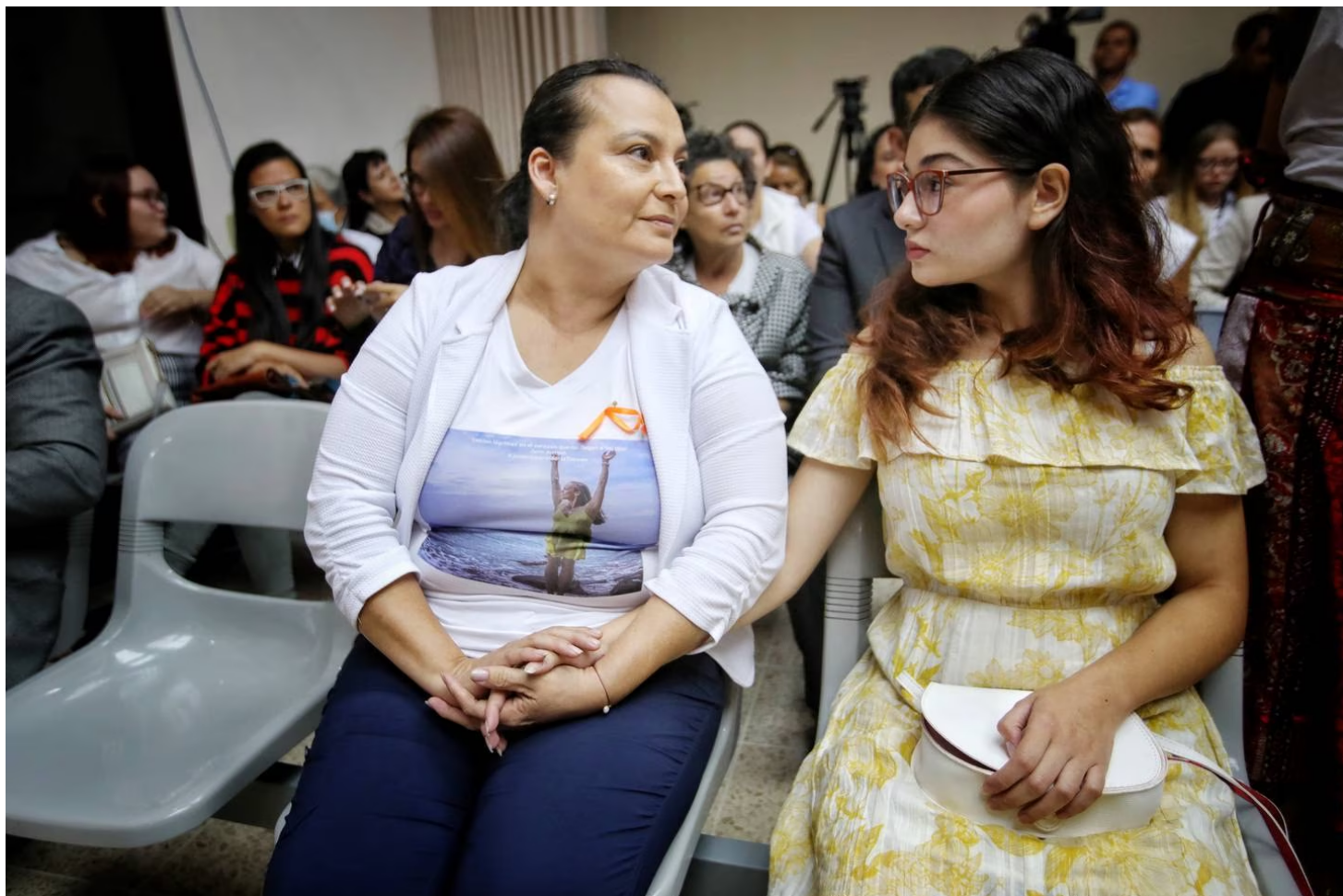
La hermana y sobrina de la víctima aseguran que esto no las hace perder la fe en la justicia.

La fiscal señaló que aquel 19 de setiembre del 2020, en San Rafael de Heredia, el radiólogo, al ver el estado de María, le colocó un arma de fuego en la boca, específicamente en el paladar duro y luego disparó. Ante esa situación, la ofendida sufrió una fractura en el cráneo que le provocó la muerte.