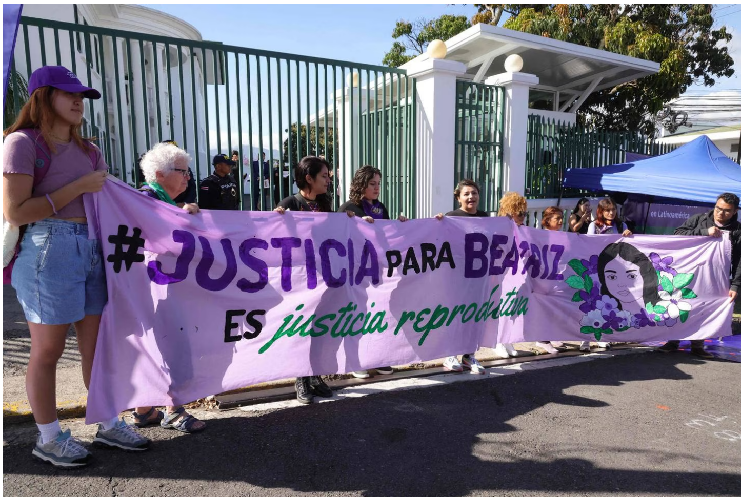
Un gran grupo de mujeres llegó a apoyar el aborto terapéutico.

La Sala Constitucional admitió la demanda de amparo y dictó una medida cautelar, pero el 28 de mayo de 2013 declaró “no ha lugar” la demanda, ya que consideró que no hubo una conducta omisiva por parte de las autoridades demandadas que hubiera producido un grave peligro a los derechos a la vida y a la salud de Beatriz.