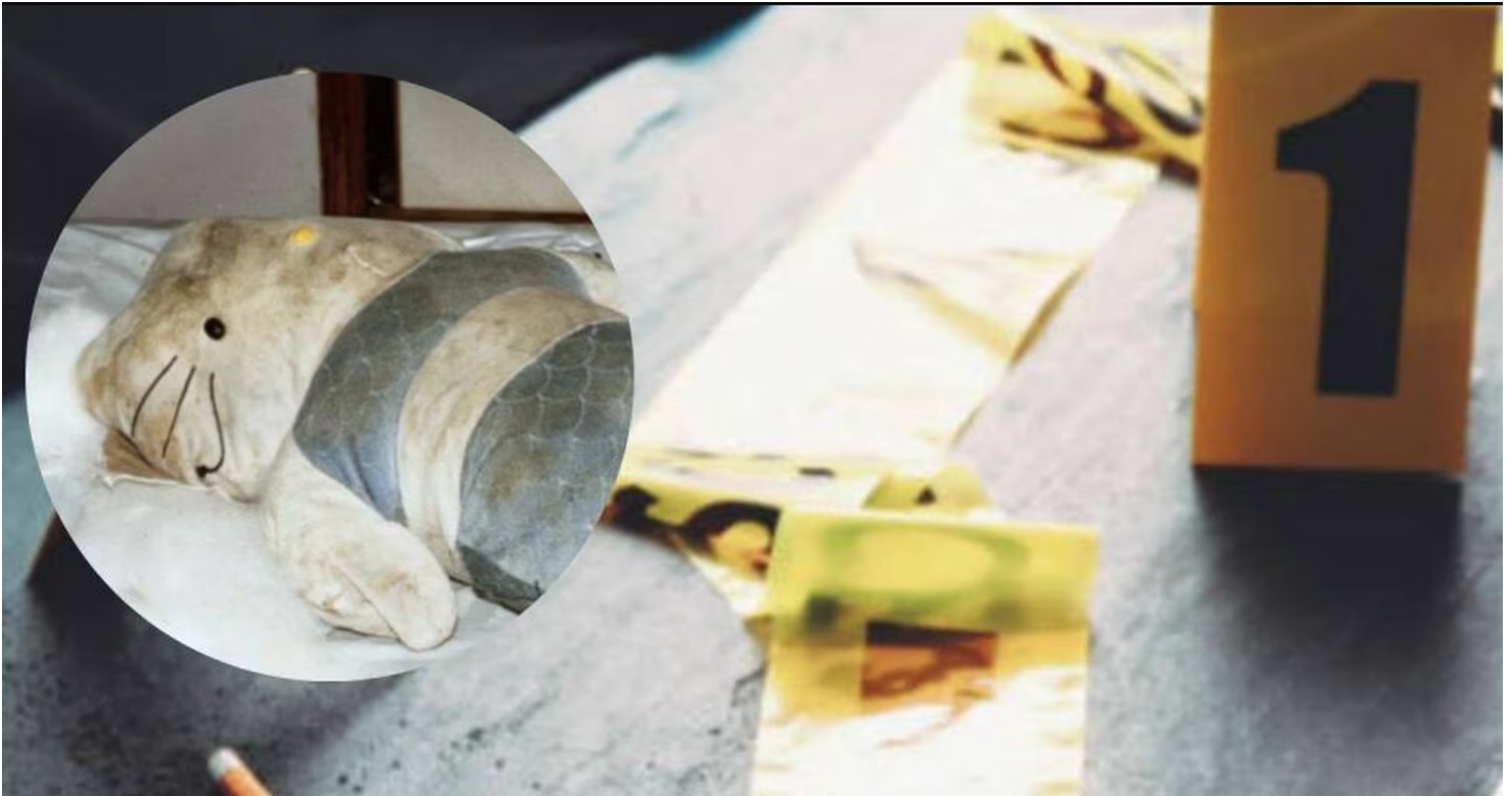
Una adolescente, novia del principal asesino, contó lo que pasó.