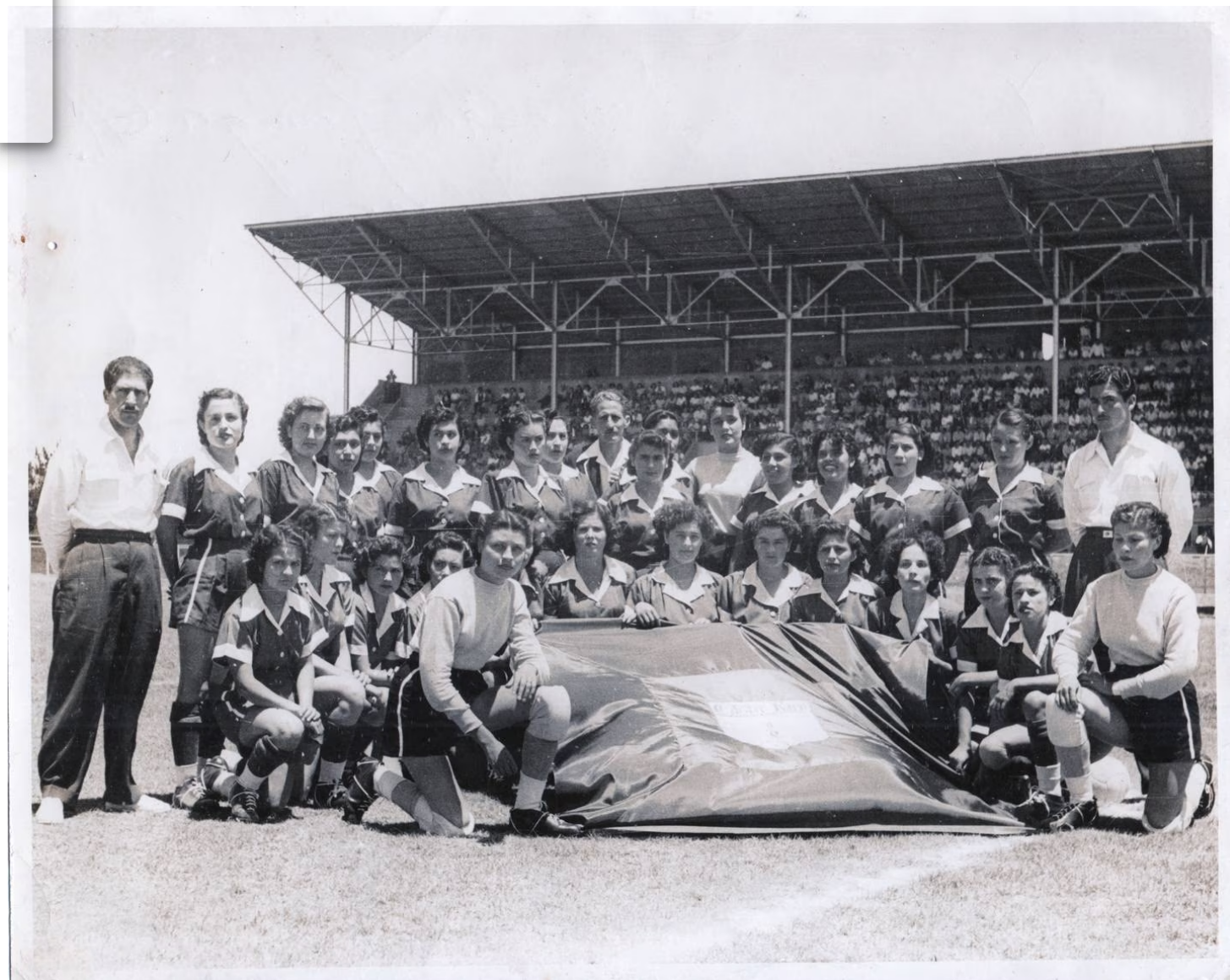
Esta es la foto oficial del debut del Deportivo Femenino Costa Rica FC, el 26 de marzo de 1950 en el Estadio Nacional.

En marzo de 1949, un grupo de mujeres escandalizó al país porque jugaban fútbol. Tuvieron que entrenar a escondidas y les dijeron que si jugaban al balompié se olvidarían de la maternidad.