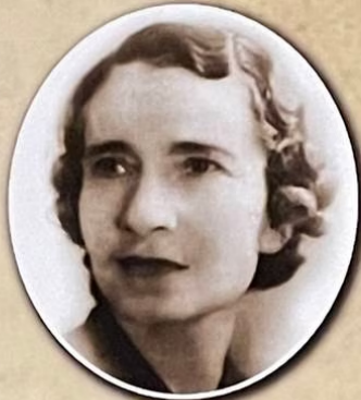
Ángela Acuña Braun Presidenta