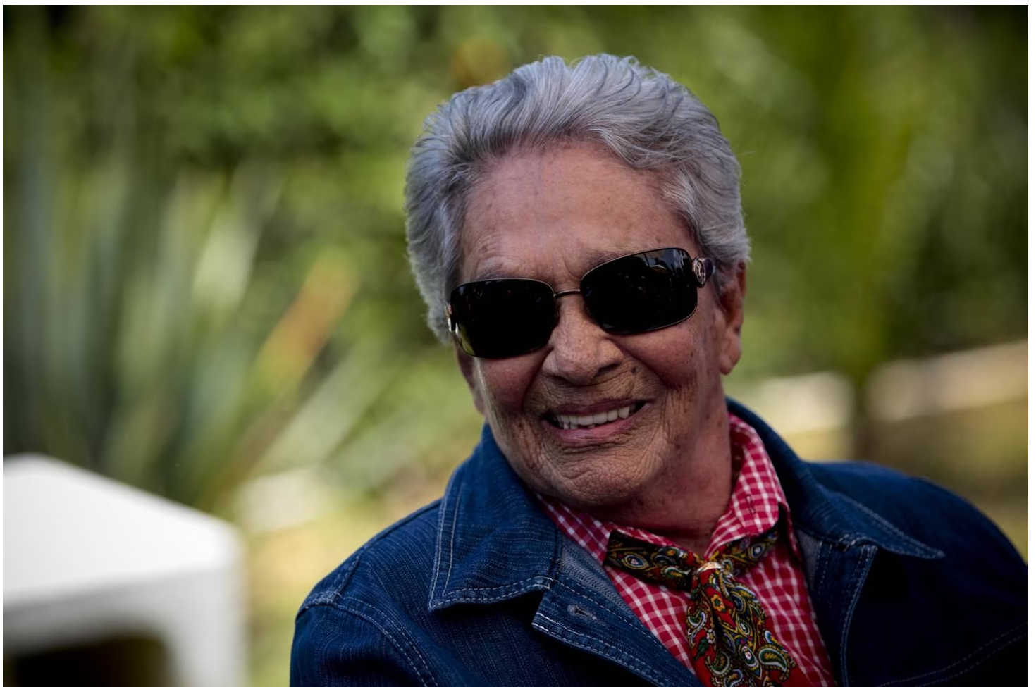
La cantante Chavela Vargas se convirtió en un ícono de la música ranchera en el mundo.

En noviembre del 2022, Chavela Vargas fue declarada como Benemérita de las Artes Patrias . Se trata de la mujer más célebre y popular de esta lista. Esta hija de San Joaquín de Flores salió de Costa Rica siendo una adolescente, huyendo de la incompreensión de la mojigata sociedad costarricense, y vivió la mayor parte de su vida en México, donde desarrolló una prolífica carrera artística. La cantante logró la fama en México en 1952 y, a partir de entonces, se convirtió en un referente de la música latinoamericana; además, fue una revolucionaria que luchó contra el machismo y la homofobia instaurado en la época. Grabó 25 discos e incursionó en la música ranchera, un género que era dominado por hombres. En