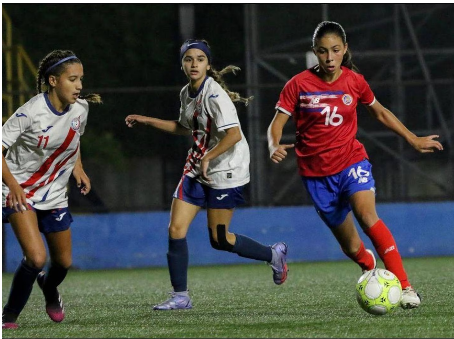
Tiene participación con la sub 15 femenina.

“Fue demasiado rápido y ella dijo que cómo iba a decir que no. Le expresamos que era probable que no jugara pero la metieron”, dijo la mamá emocionada y con la voz entrecortada.