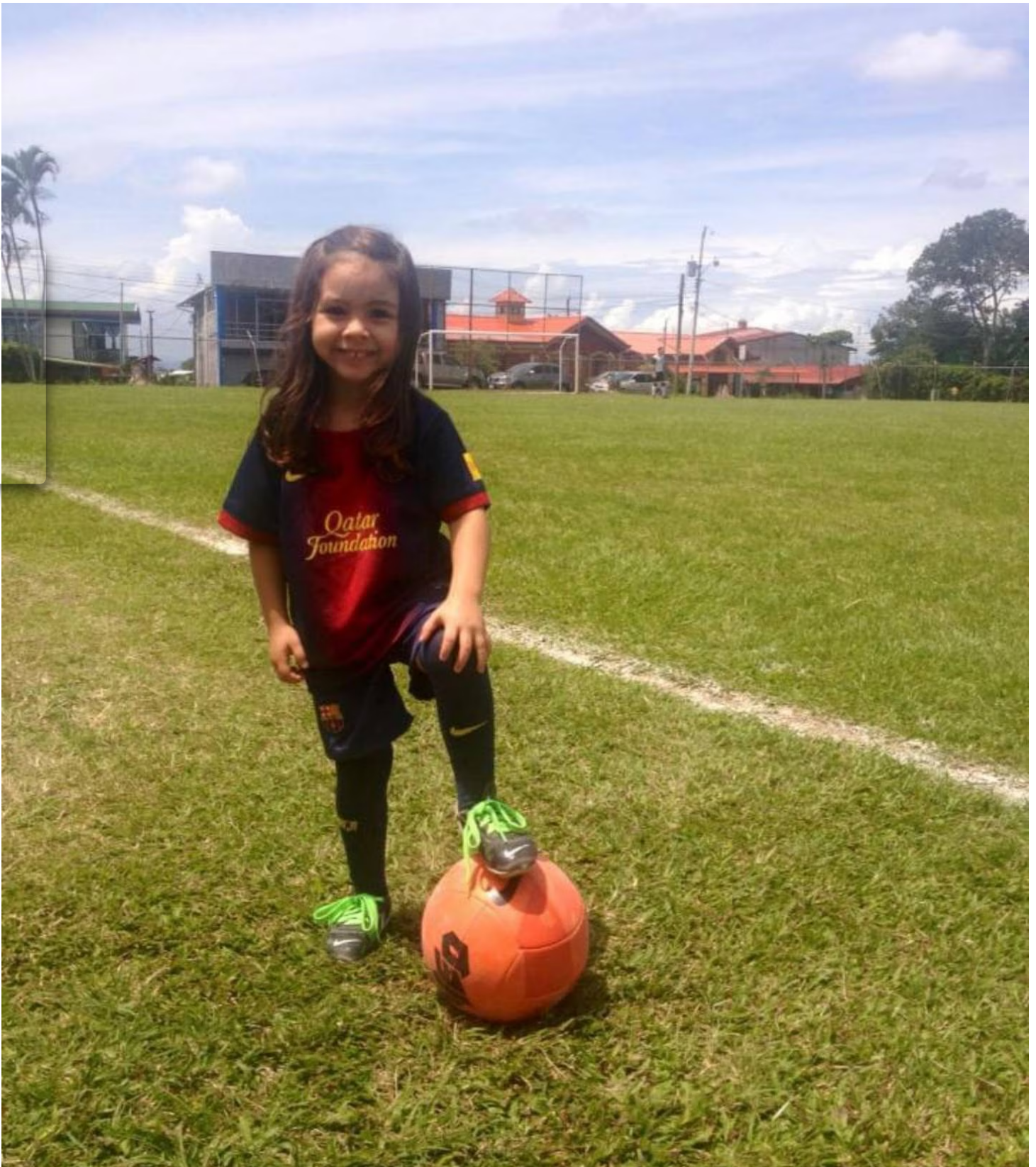
Ese uniforme de Barcelona la enamoró.

Allí permaneció hasta los seis años y pasó a integrar un equipo de niñas que participó en un campeonato nacional y quedaron campeonas. Era la más pequeña.