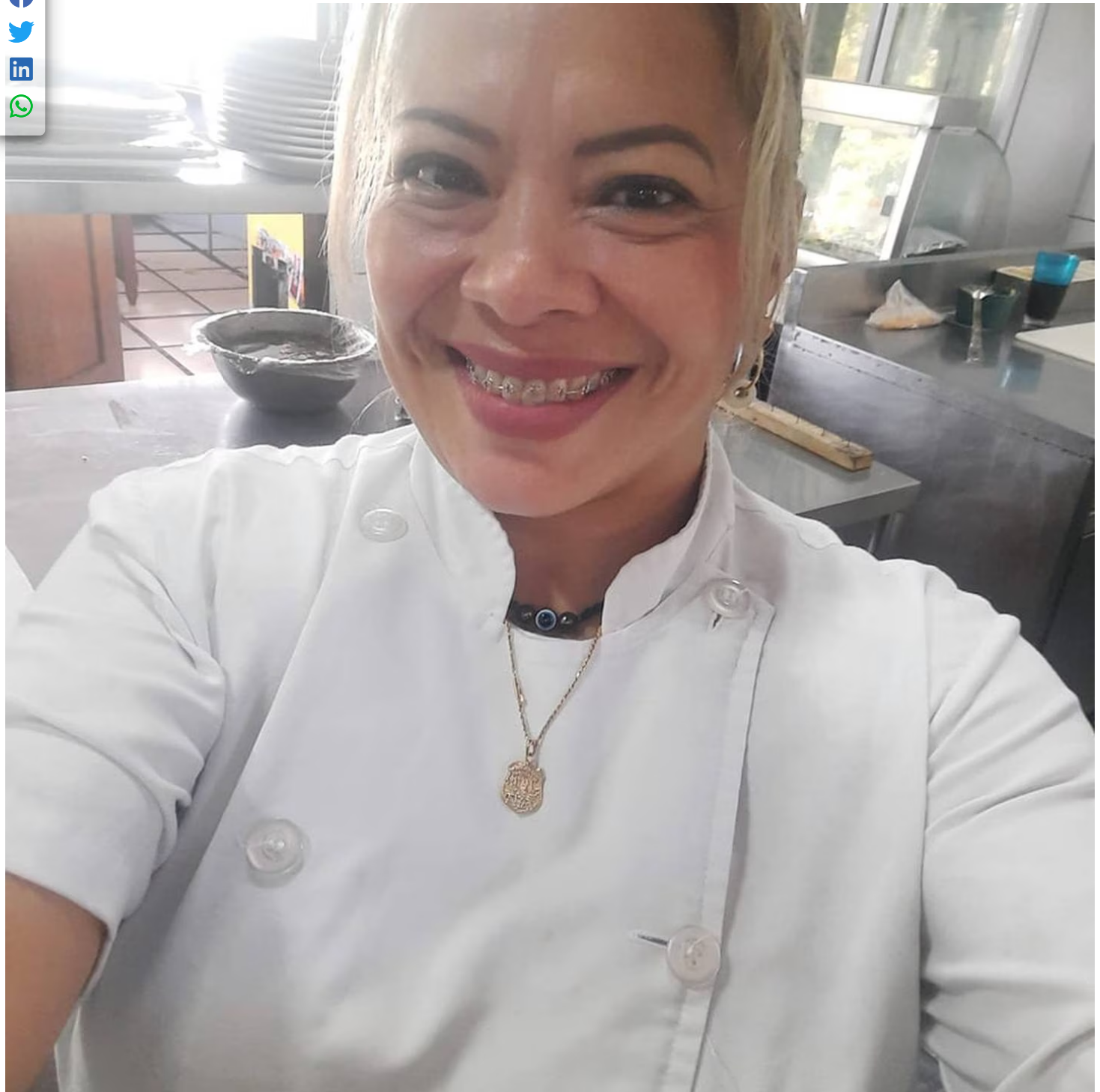
La mujer, de 46 años, trabajó en varios hoteles de Manuel Antonio, Quepos.