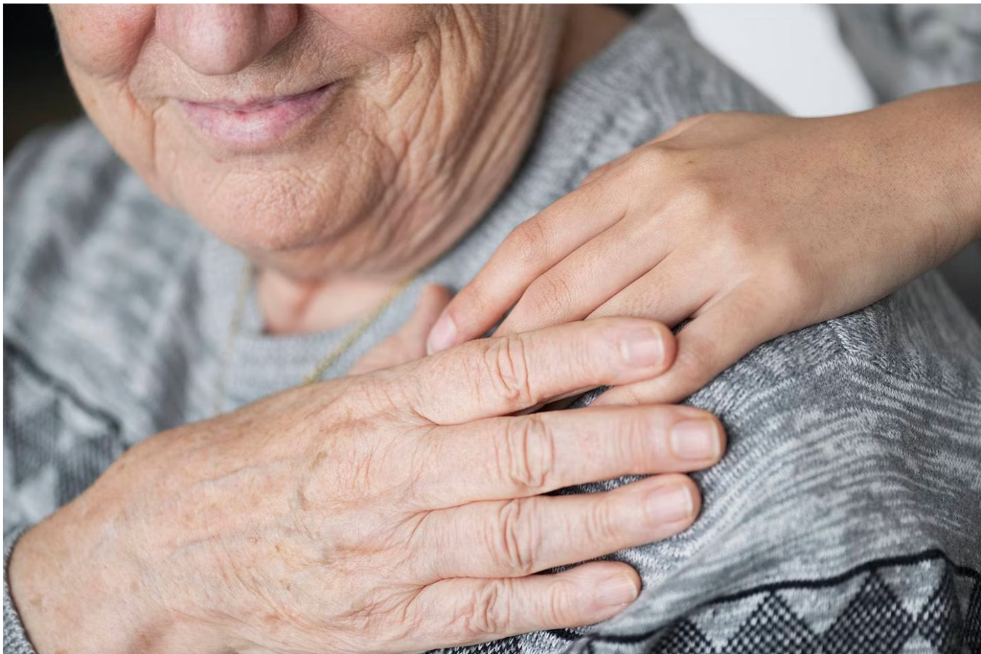
En el país hay 936 viejitos en abandono.