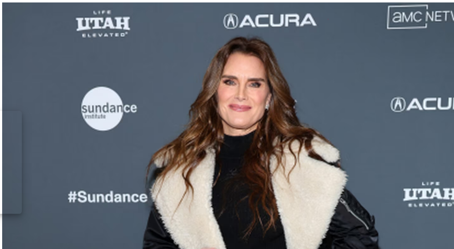
Brooke Shields

Pero hubo una historia en particular que llamó la atención por lo grave que era, Brooke relató que un hombre con quien se reunió para platicar respecto a una nueva película abusó sexualmente de ella en una habitación de hotel.