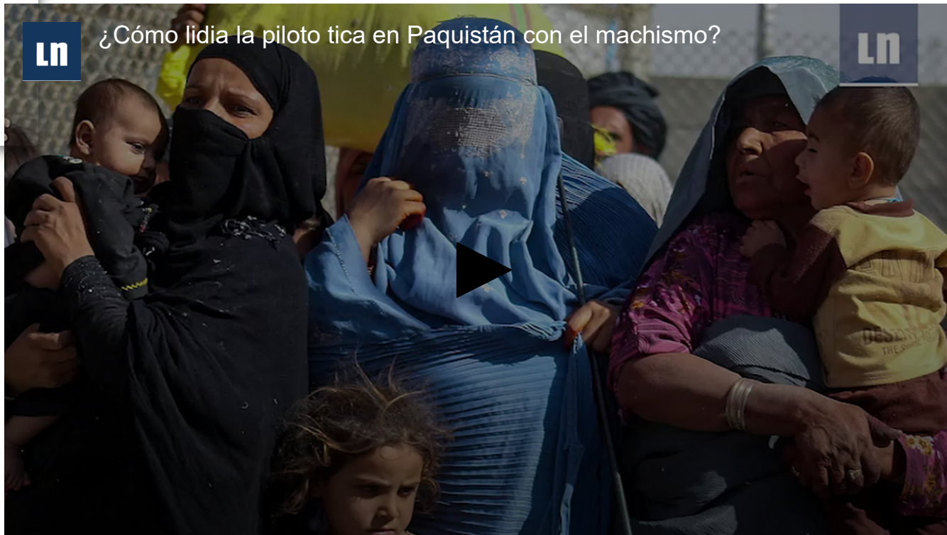
¿Cómo lidia la piloto tica en Paquistán con el machismo?

“Esas son cosas del día a día, pero la gente ya me ha ido conociendo y saben que no me dejo, pero es una lucha diaria porque hay que estar a la defensiva”.