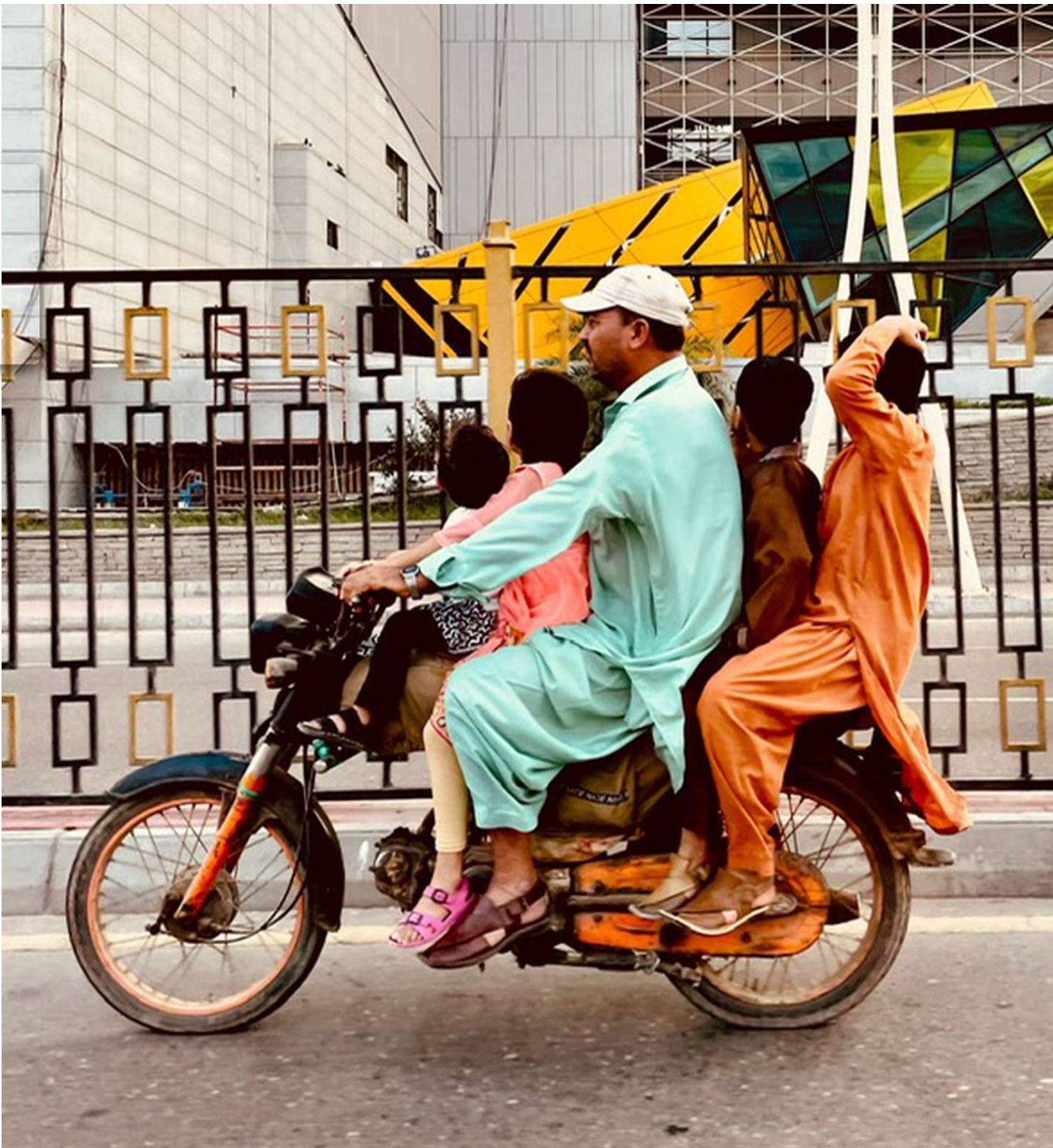
Los paisajes que se ven en Paquistán son muy diferentes a los vistos en Costa Rica.

“Me hizo mucha falta celebrar”, admitió.