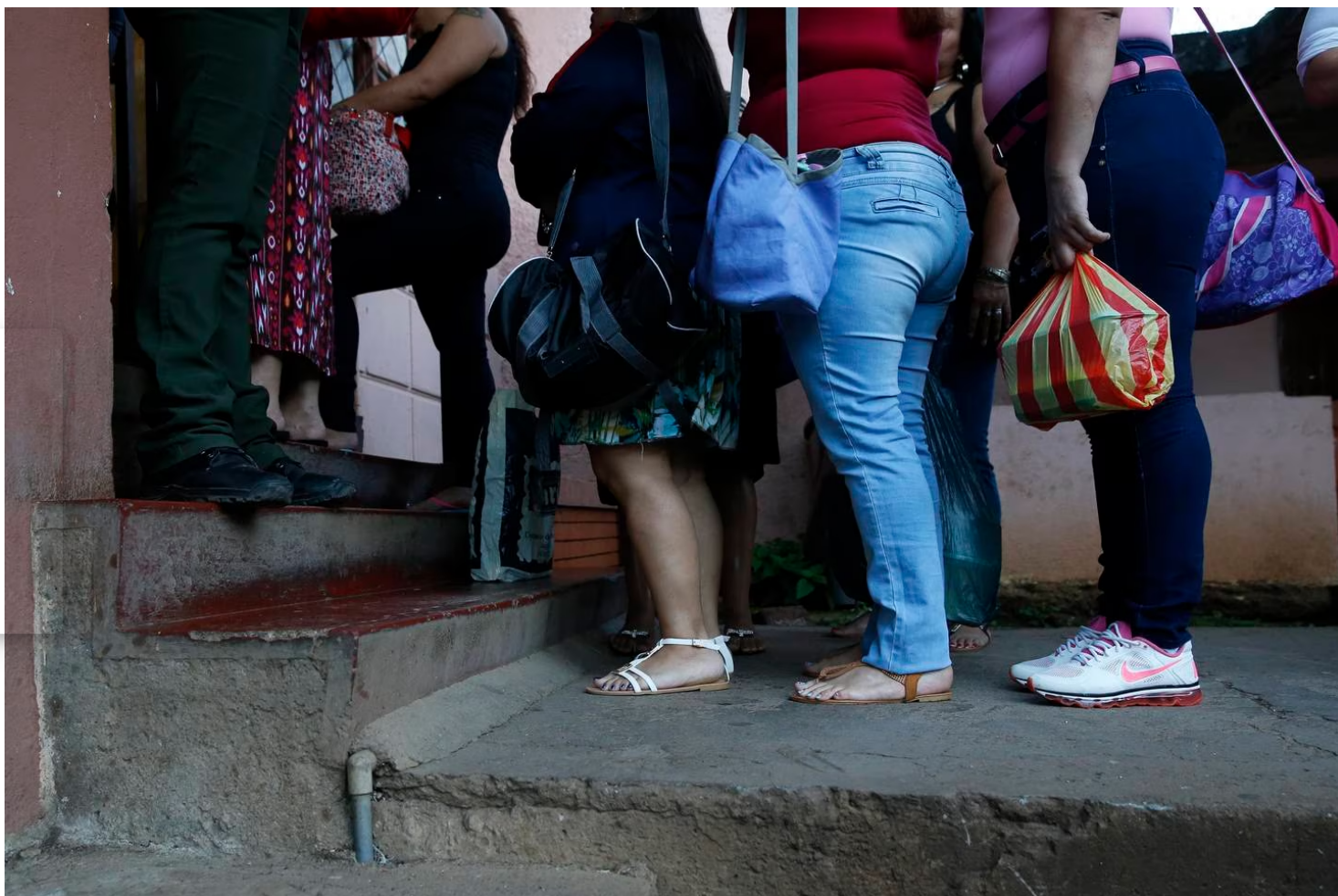
Las mujeres aseguran que las restricciones se pusieron más severas tras la pandemia.