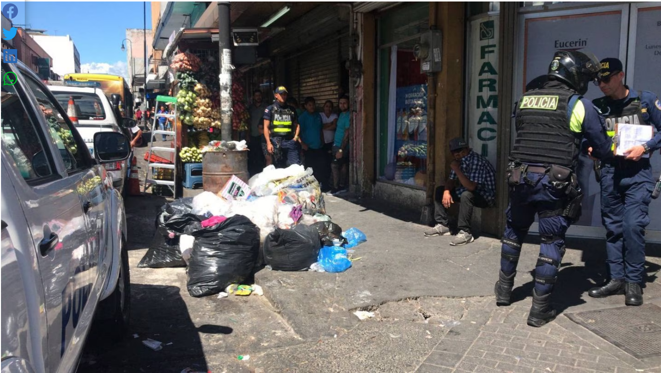
El indigente buscaba material reciclable en las bolsas.

Un fuerte y extraño olor, muy diferente al de la basura, fue lo que llevó a un indigente a encontrar un feto que fue abandonado dentro de una bolsa plástica en pleno centro de San José.