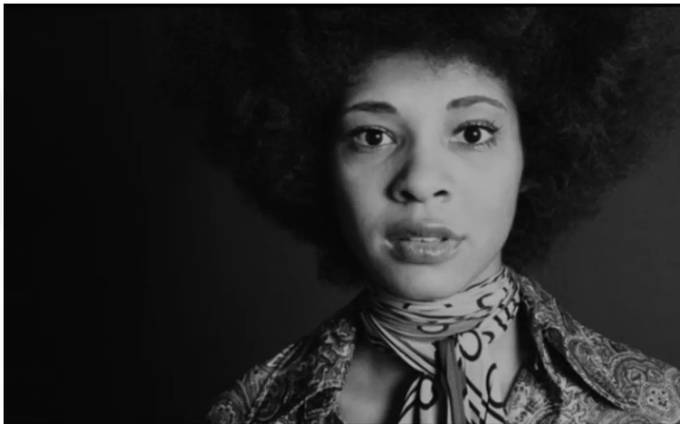
Betty Davis se mantenía alejada del ojo público desde hace cuatro décadas, (Captura de video)

música. Su primer proyecto musical lo lanzó en 1964, cuando estrenó el sencillo Get Ready For Betty , bajo su nombre de nacimiento Betty Mabry.